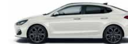
Polar White (PYW)