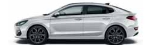
Platinum Silver (U3S)