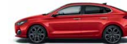
Engine Red (JHR)