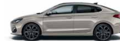
White Sand (Y3Y)