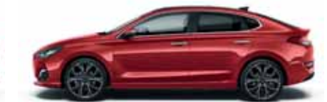
Fiery Red (PR2)