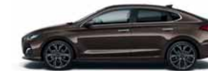
Moon Rock (XN3)