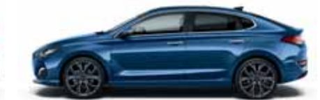
Stargazing Blue (SG5)