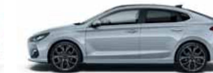
Clean Slate (UB2)