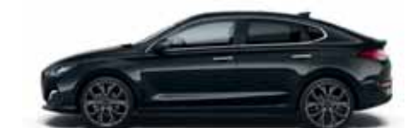
Phantom Black (PAE)