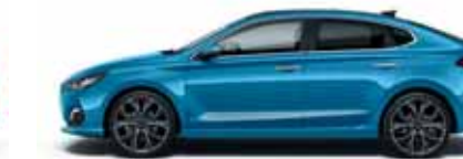
Ara Blue (R3U)