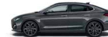
Pepper Grey (Z3G)