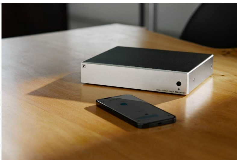
Sennheiser MobileConnect Station mit Smartphone

Wedemark, 12. Dezember 2025 Sennheiser bringt zusammen mit ProDVX Europe die MobileConnect-Lösung direkt auf die Android-Panel-PCs von ProDVX – für einfachere Zusammenarbeit und ein besseres Audioerlebnis in Schule, Büro und Co.