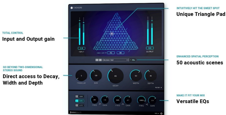
The EXOVERB user interface

menambahkan bahwa dengan adanya EXOVERB, pengguna dapat merasakan langsung kemampuan Dear Reality yang telah menerapkan dasar-dasar teknologi audio spasial ke dalam plugin reverb stereo pertamanya ini.