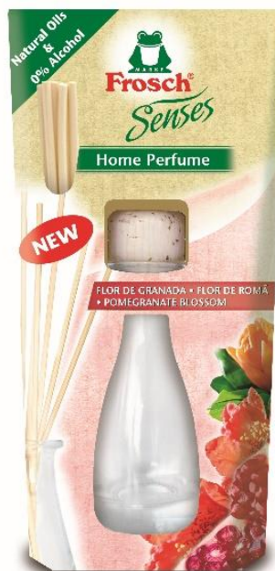
Frosch Geurverspreider Granaatappel, 65 ml, € 6.99

Verkrijgbaar in grootdistributie en bij Di