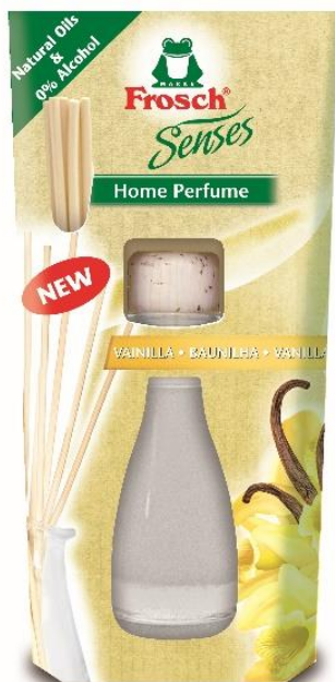
Frosch Geurverspreider Vanille, 65 ml, € 6.99