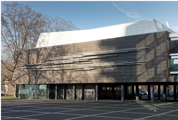
Die Südwand des Kleinen Hauses ziert ein Metallrohrrelief von Bildhauer Norbert Kricke

Das Kleine Haus (312 Plätze) ist durch eine Brücke mit dem Großen Haus verbunden. Durch das Entfernen beweglicher Trennwände und Türen kann der Zuschauerraum bis ins Foyer erweitert werden. Die Außenwand des Kleinen Hauses ist mit dunkelgrauen Natursteinplatten verkleidet; die Südwand ziert ein Metallrohrrelief von Norbert Kricke.