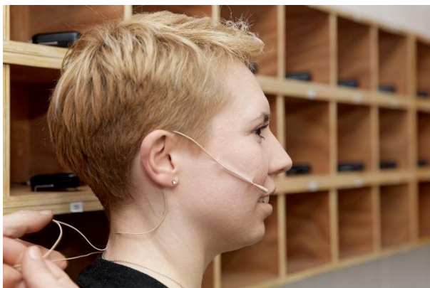
In der „Schleuse“ werden die Akteure*innen mikrofoniert, hier lagern die Mini-Bodypacks SK 6212 in nummerierten Fächern

Am Ausgabeplatz befindet sich ein Laptop, auf dem der Sennheiser Wireless Systems Manager installiert ist: Die WSM-Software sorgt auch in komplexen Szenarien für Übersicht, zumal mit ihr nicht nur die neuen Digital 6000 Systeme, sondern auch die bewährten analogen Funkstrecken des Hauses verwaltet werden. Zu diesen gehören unter anderem ein True-Diversity-Receiver EM 3732-II (für zwei SKP 3000 Aufstecksender), ein EM 2050 in der Tonregie (Ansagen, Beleuchtungsproben etc.) sowie diverse SKM 5200 Handsender und SK 5212-II Taschensender. Im Kleinen Haus und im Foyer sind 24 analoge Funkstrecken aus der Sennheiser 3000er Serie verfügbar. Inklusive In-Ear-Monitoring und Audiodeskription verfügt das MiR über 75 Sennheiser-Funkstrecken.