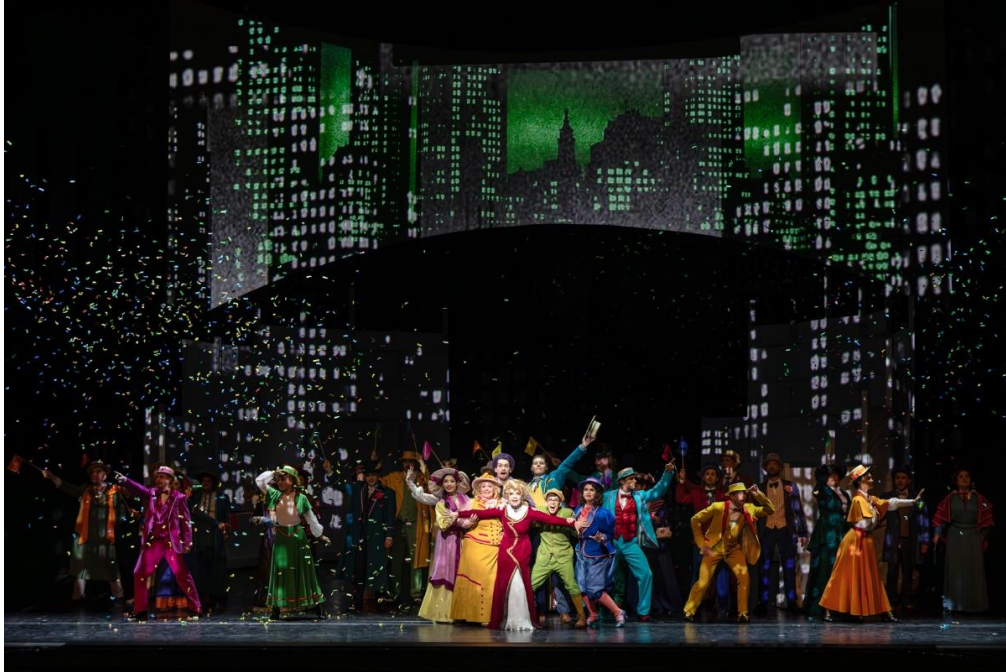
Die neuen Sennheiser Digital 6000 Systeme erlebten ihre Premiere im Januar 2024 bei „Hello, Dolly!“

Am Ausgabeplatz befindet sich ein Laptop, auf dem der Sennheiser Wireless Systems Manager installiert ist: Die WSM-Software sorgt auch in komplexen Szenarien für Übersicht, zumal mit ihr nicht nur die neuen Digital 6000 Systeme, sondern auch die bewährten analogen Funkstrecken des Hauses verwaltet werden. Zu diesen gehören unter anderem ein True-Diversity-Receiver EM 3732-II (für zwei SKP 3000 Aufstecksender), ein EM 2050 in der Tonregie (Ansagen, Beleuchtungsproben etc.) sowie diverse SKM 5200 Handsender und SK 5212-II Taschensender. Im Kleinen Haus und im Foyer sind 24 analoge Funkstrecken aus der Sennheiser 3000er Serie verfügbar. Inklusive In-Ear-Monitoring und Audiodeskription verfügt das MiR über 75 Sennheiser-Funkstrecken.