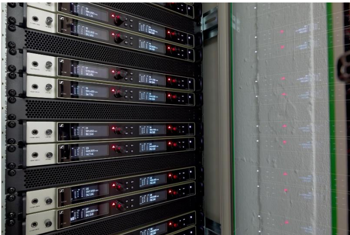
Ein Blick in den Schrank mit den Mikrofonempfängern EM 6000. Die Signale werden über zirkular polarisierte Wendelantennen A 5000-CP empfangen

Um die Aktionsfläche der Bühnenakteur*innen perfekt abzudecken, sind im Großen Haus mehrere Sennheiser Antennen verteilt. Zu den Besonderheiten gehört, dass zirkular polarisierte A 5000-CP Wendelantennen nicht für IEM-Zwecke, sondern als Empfangsantennen für Hand- und Taschensender genutzt werden. Zwei A 5000-CP sind links und rechts im Portal installiert, wo sich auch zwei aktive AD-3700 Richtantennen mit integrierten Boostern befinden. Für Szenarien mit geschlossenem Eisernen Vorhang wurden im Rückraum des Großen Hauses zwei aktive Breitband-Rundstrahlantennen A 3700 (mit integriertem Antennen-Verstärker AB 3700) angebracht. Für drahtloses In-Ear-Monitoring und Audiodeskription stehen weitere Sennheiser-Antennen bereit. In sieben intelligenten Sennheiser-Ladegeräten L 6000 werden die Akkus der Handsender und der Mini-Taschensender wieder aufgeladen.