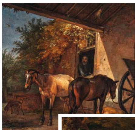
'Open schuur met twee ploegpaarden', Paulus Potter, 1649, langdurige bruikleen collectie Van der Velden-Teurlings