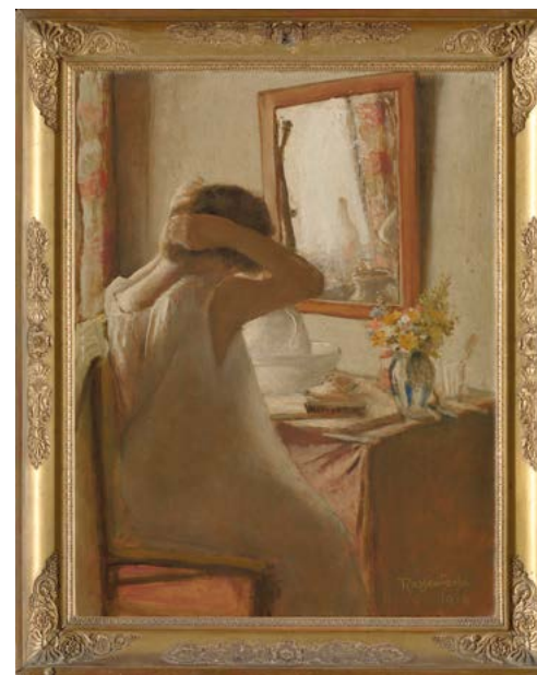
'La toilette', Armand Rassenfosse, 1919, Collectie M Leuven