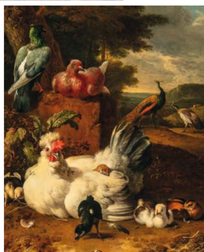
'Landschap met een kip, kuikens, duiven en pauwen naast een stenen muur', Melchior D'Hondecoeter, ca.1680-1685, langdurige bruikleen collectie Van der Velden-Teurlings