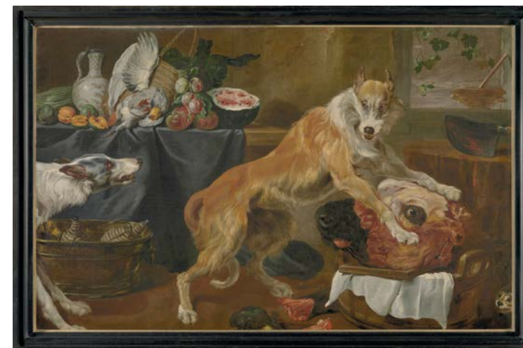
Hondengevecht, Paul de Vos, na 1595-voor 1678, Collectie M Leuven