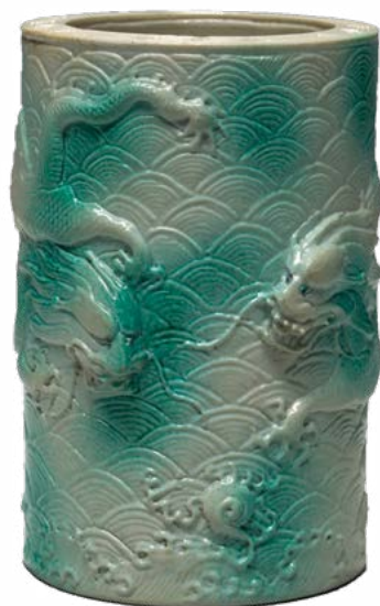
Chinees borstelhouder, Onbekende maker, 1850-1899