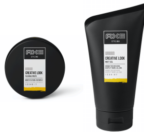
Urban Creative look