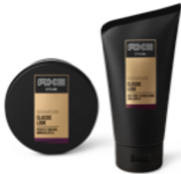
Signature Classic look