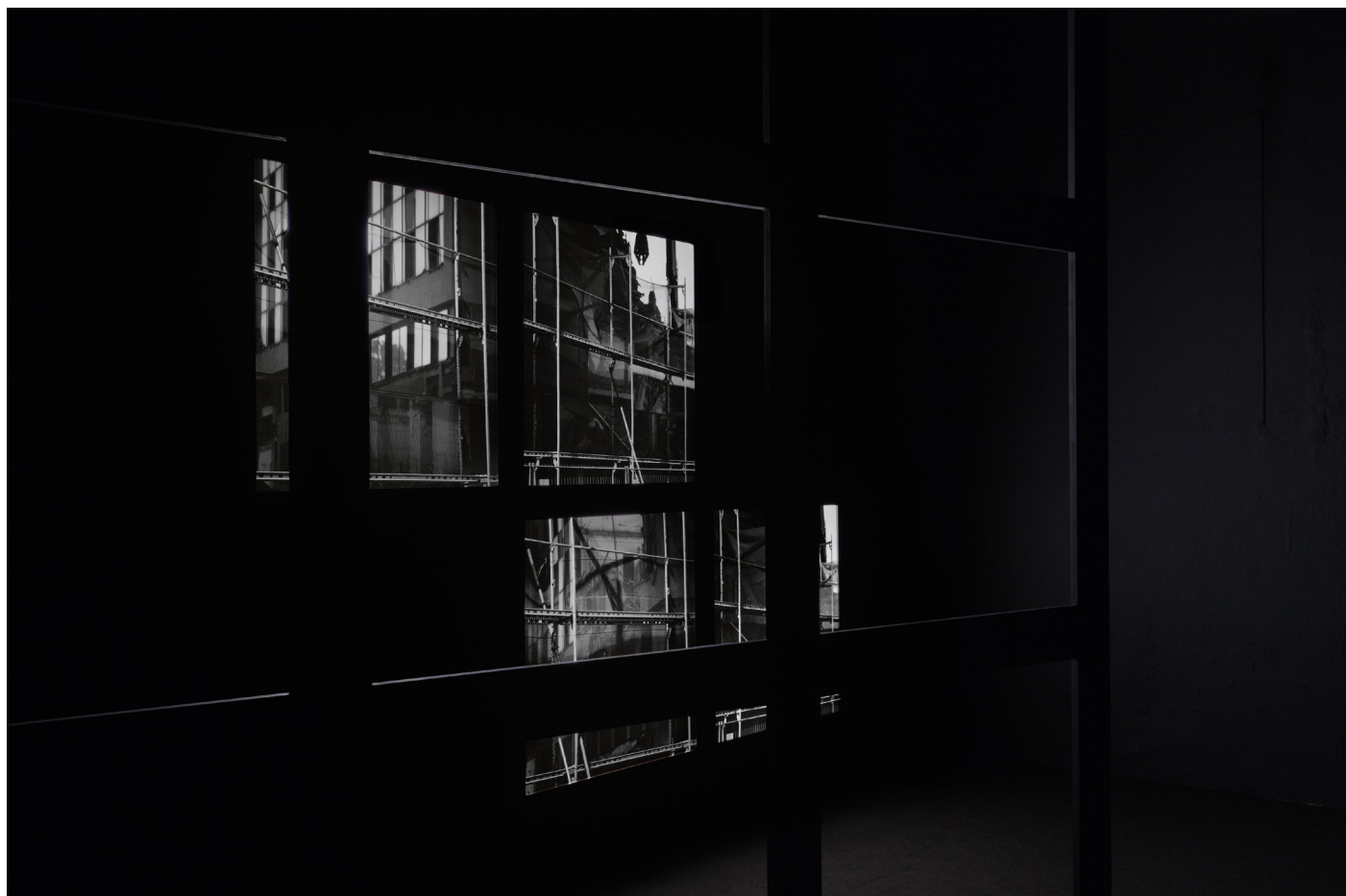
Paul Kuimet, Grid Study , 2016, installation view.