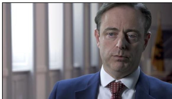
Bart De Wever