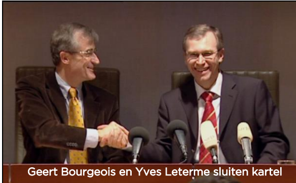
Geert Bourgeois en Yves Leterme sluiten kartel

CD&V en N-VA dromen ervan om een grote centropartij te worden in Vlaanderen. Hun plannen lopen gaandeweg stuk op het groeiende onderlinge wantrouwen.