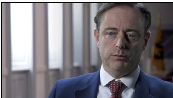
Bart De Wever

Met getuigenissen van Bart De Wever, Jo Vandeurzen, Ben Weyts, Inge Vervotte, Kris Peeters en Yves Leterme.