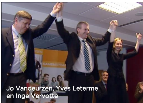
Jo Vandeuren, Yves Leterme en Inge Vervotte

Leterme geniet in Vlaanderen een enorme populariteit en de partijtop beslist in 2007 om hem naar voor te schuiven als uitdager van premier Guy Verhofstadt. De campagne is sterk communautair geladen. Paars verliest de verkiezingen, Leterme bereikt een absoluut hoogtepunt met 800.000 voorkeurstemmen en begint aan de zware opdracht om een federale regering te vormen. Na vruchteloze communautaire onderhandelingen, een interimpremier Verhofstadt en ondanks een levensbedreigende ziekte wordt Leterme met Pasen 2008 eindelijk premier.