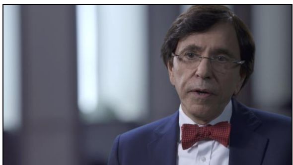
Elio Di Rupo