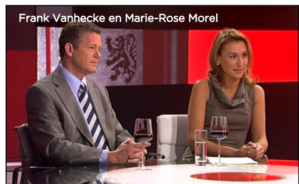
Frank Vanhecke en Marie-Rose Morel

Meer en meer begint Marie-Rose Morel zich te verzetten tegen de harde lijn van Dewinter en krijgt ze geleidelijk aan voorzitter Vanhecke op haar hand. Vanhecke, die niet de moed heeft om Dewinter in te tomen of de partij van koers te doen veranderen. De knallende ruzies komen open en bloot op straat te liggen. Vanhecke, Dewinter en Annemans, de drie vrienden van weleer, worden gezworen vijanden wanneer Vanhecke openlijk de kant kiest van Morel, met wie hij bovendien een relatie begint.