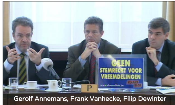
Gerolf Annemans, Frank Vanhecke, Filip Dewinter

Begin deze eeuw leidt het radicale trio Vanhecke - Dewinter - Annemans het Vlaams Blok van overwinning naar overwinning. Niets lijkt hen te kunnen tegenhouden, tot in het voorjaar van 2004 het Hof van Beroep van Gent de partij veroordeelt wegens discriminatie. Ook al beweert de partij bij hoog en bij laag dat ze niet racistisch is.