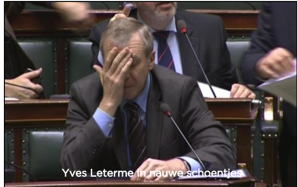
Yves Leterme in nauwe schoentjes

In de herfst van 2008 staat de regering Leterme voor een ongeziene opdracht: de redding van de grootbank Fortis. Een eerste poging met de Nederlanders draait op niets uit. Als de regering Fortis verkoopt aan BNP Paribas staan de aandeelhouders op hun achterste poten. Ze trekken naar de rechtbank die eind 2008 beslist dat de verkoop wordt opgeschort.