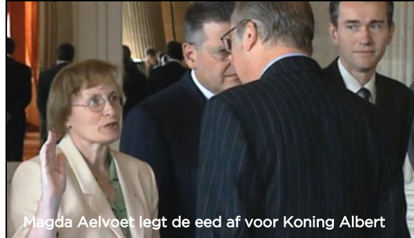
Magda Aelvoet legt de eed af voor Koning Albert

In 1999 belanden de groenen (Agalev en Ecolo) voor de eerste keer in de geschiedenis in de paarsgroene regeringen van premier Guy Verhofstadt en Vlaams minister-president Patrick Dewael . De CVP verdwijnt naar de oppositiebanken.