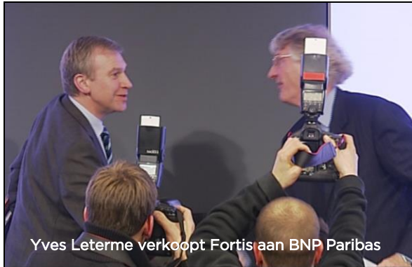
Yves Leterme verkoopt Fortis aan BNP Paribas

De val van de regering Leterme eind 2008 is een van de pijnlijkste periodes ooit in de Wetstraat. In de nasleep van de bankencrisis botsen de hoogste politieke gezagsdragers van het land met de hoogste magistraten.