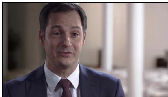
Alexander De Croo