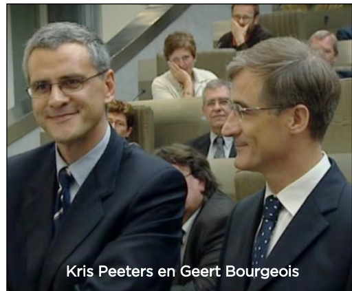
Kris Peeters en Geert Bourgeois