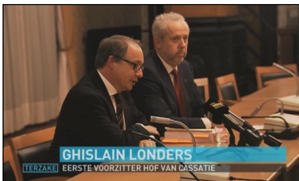
GHISLAIN LONDERS EERSTE VOORZITTER HOF VAN CASSATIE

Ghislain Londers , de hoogste magistraat van het land, beweert belangrijke aanwijzingen te hebben van politieke druk uitgeoefend door onder meer de minister van justitie Vandeurzen. Dat is nog nooit eerder vertoond. Heel het land kan de gebeurtenissen live op televisie volgen. Eerst neemt een zwaar aangeslagen Jo Vandeurzen ontslag die zich door iedereen in de steek gelaten voelt. Kort daarop volgt het ontslag van de hele regering Leterme. Het zorgt voor zure en bitse reacties.