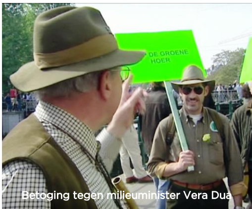
Betoging tegen milieuminister Vera Dua

In 1999 belanden de groenen (Agalev en Ecolo) voor de eerste keer in de geschiedenis in de paarsgroene regeringen van premier Guy Verhofstadt en Vlaams minister-president Patrick Dewael . De CVP verdwijnt naar de oppositiebanken.