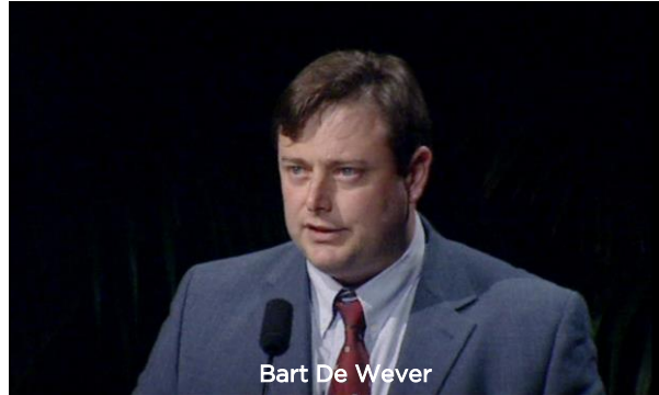
Bart De Wever

De federale verkiezingen van 2003 zijn een zware tegenvaller zowel voor CD&V die geen winst boekt na vier jaar oppositie, als voor de nieuwe partij N-VA waar Geert Bourgeois als enige verkozenen overblijft.