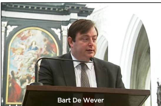
Bart De Wever