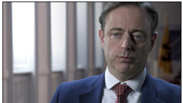
Bart De Wever