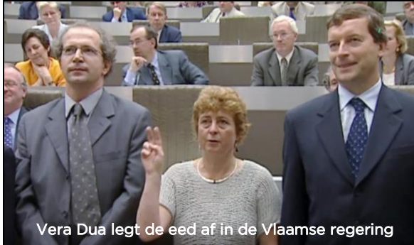
Vera Dua legt de eed af in de Vlaamse regering

Het verhaal van een groene partij die door regeringsdeelname van de kaart wordt geveegd.