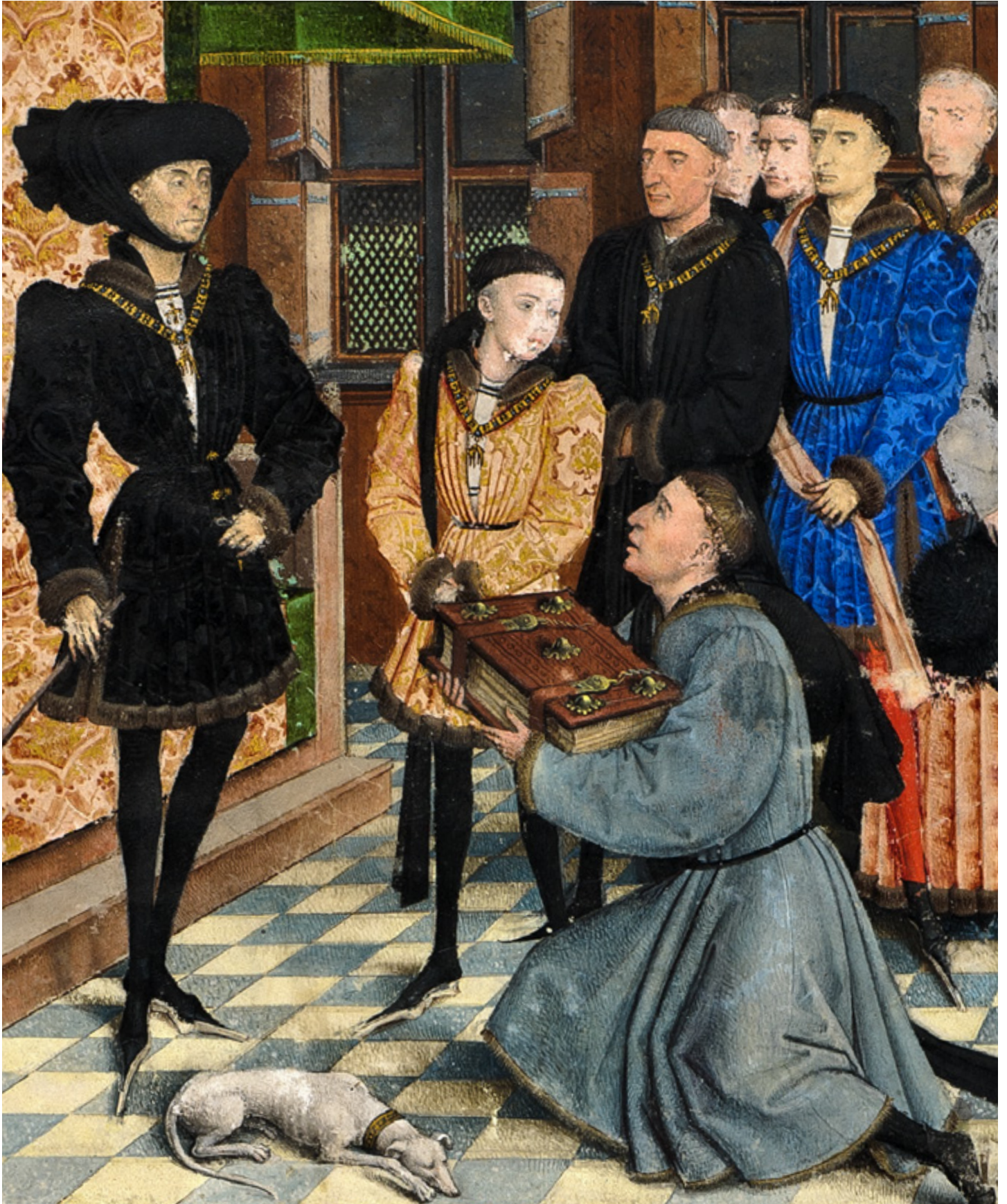
Afbeelding: Filips de Goede neemt het boek in ontvangst. Detail van de openingsminiatur van de Chroniques de Hainaut (KBR ms. 9242), toegeschreven aan Rogier van der Weyden