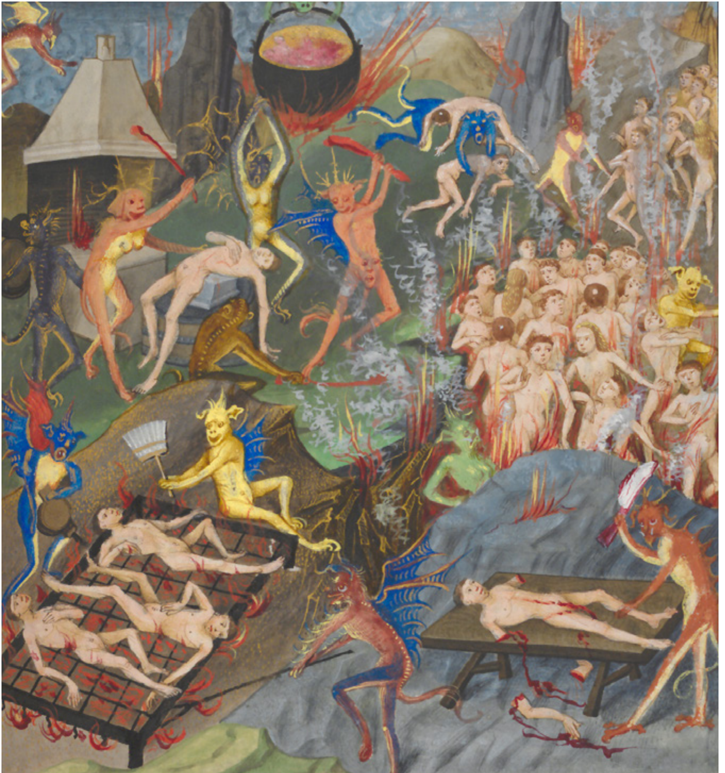
Afbeelding: Detail van de hel door Jean Tavernier in het Traité des quatre dernières choses (KBR, ms. 11129)