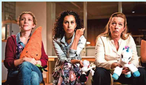
► De Nederlandse hitreeks De luizenmoeder heeft nu ook een Vlaamse versie. Totaal onnodig, vindt onze man.

Heeft u La casa de papel gezien? Dan viel u wellicht ook voor de charme van dat lokale karakter, met dat heerlijke Spaans dat u dankzij ondertitels toch helemaal kon volgen. Want geef toe, dat Duitsers en Fransen buitenlandse fictie dubben, dat vindt u toch ook een beetje belachelijk?