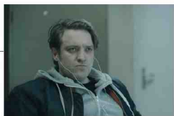
'De dag': 1 miljoen keer opgevraagd, meer mensen kijken uitgesteld dan live.

De kijkcijfermetingen voor televisie zijn stilaan zo achterhaald als Windows 95. Het volstaat een blik te werpen op de scores van de momenteel lopende Vlaamse fictiereeksen om dat in te zien. Moet dat niet anders? 'We zijn ermee bezig, maar het is ingewikkeld.' TOM HEREMANS