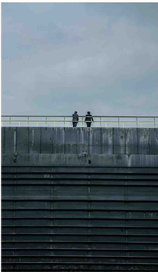
'Over water': 850.000 kijkers, uitgesteld kijken tilt de reeks over het miljoen. En dan zijn er nog de kijkers die ze opvroegen via Telenet, Proximus of VRT.nu.

En wat te denken van het 'prestigieuze' Over water , dat op zond-