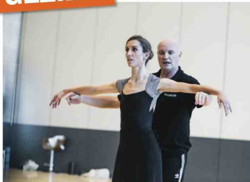
'Hanne Danst' Canvas, dinsdag, 21.20 uur

De nieuwe tv-programma's gewikt en gewogen.