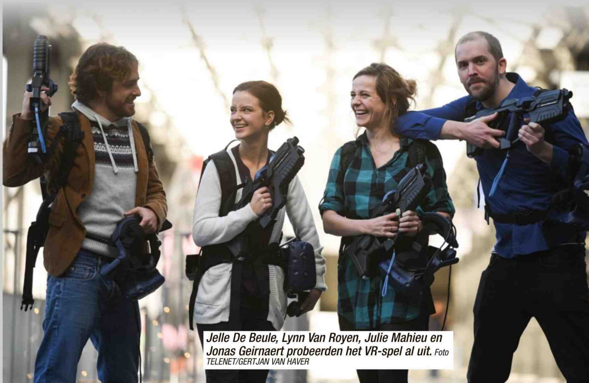
Jelle De Beule, Lynn Van Royen, Julie Mahieu en Jonas Geirnaert probeerden het VR-spel al uit.

→ https://theparkplayground.com/nl/events/