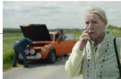
'Eigen kweek': 1,4 miljoen live kijkers, nog eens 300.000 mensen kijken uitgesteld.

Op dinsdag 8 januari keken 1,4 miljoen mensen om iets over half negen naar de eerste aflevering van Eigen kweek op Eén. Dat is veel. Twee dagen later keken op datzelfde uur 385.000 naar de eerste dubbelaflevering van De dag op Vier. Dat is niet zo veel. Nochtans werd maar De dag reikhalzend uitgezonden, meer dan naar een derde seizoen van Eigen kweek . Kwaliteit en kijkcijfers gaan niet altijd hand in hand, en het potentieel van Vier zal altijd lager liggen dan dat van Eén, maar toch.