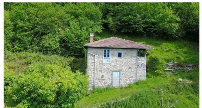
Het uitzicht vanuit het nog te bouwen guesthouse. FOTO

→ www.lacollecha.es → 'Eviva España', Eén, 20.35 uur