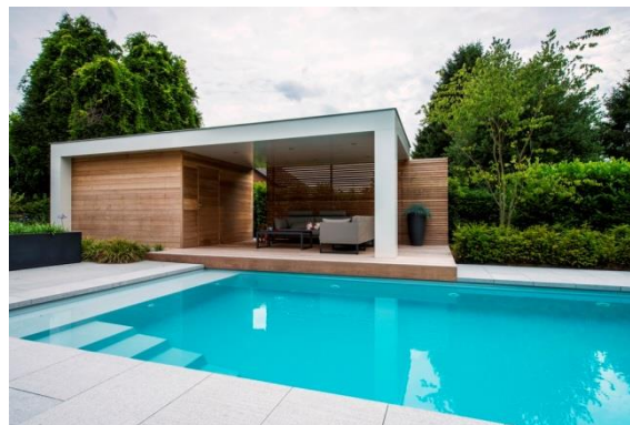
La Plage 9