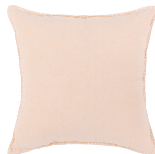
Katoenen kussenhoes Viale € 9,99