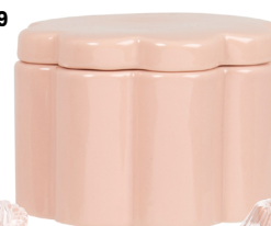
Porseleinen opbergdoosje € 13,99