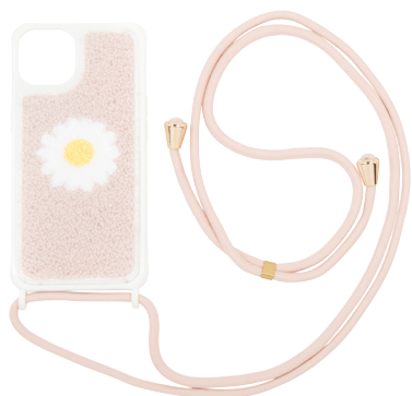
Kunststof gsm-hoesje Daisy (iPhone 13) € 9,99