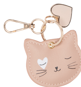
Roze sleutelhanger in kunststof € 5,99