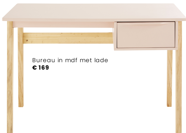
Bureau in mdf met lade € 169