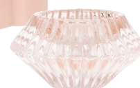
Theelichthouder van roze glas € 4,99