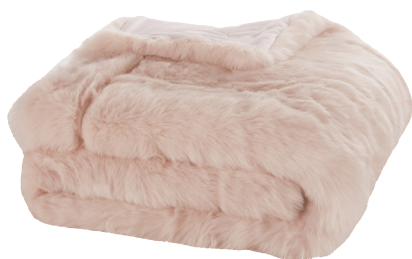
Plaid Altai van roze imitatiebont € 169