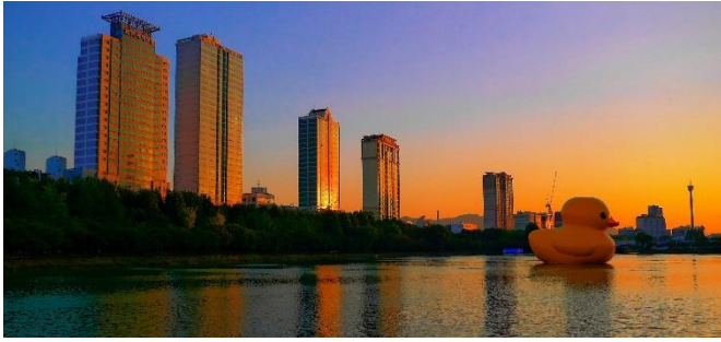
Flickr Creative Commons – travel oriented