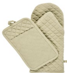
OXFORD 665133, 665154