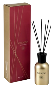
ESCAPE GOLDEN 665805