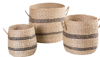
BILLY RAY 252328