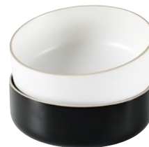
ELEMENTS 666099, 666106