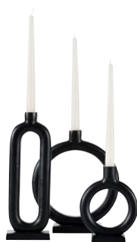
NOVA 667016, 667044, 667051