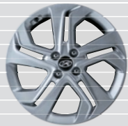
Vertex 205/45 R17