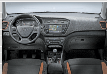
Ampla Tessuto nero/arancione Comfort Grey