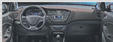
Vertex Cappuccino ‡