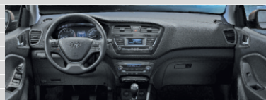
Vertex Comfort Grey