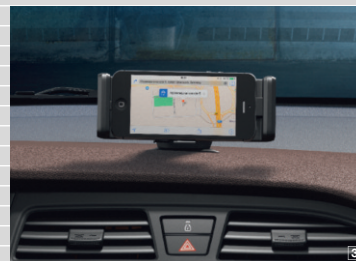
3 Fissaggio per smartphone per veicoli con preparazione Smartphone Docking Station compatibile per iPhone 5/5s/6/6s (senza 6 Plus), Samsung Galaxy fino a 5.5"