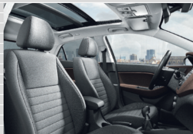
Vertex Pelle nera