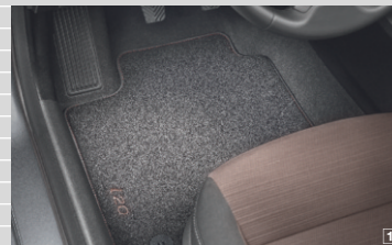
1 Tappetini velours