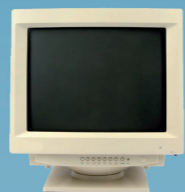
1977 De eerste pc.