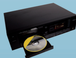
1996 De eerste dvd-speler