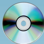
1982 Uitvinding van de cd