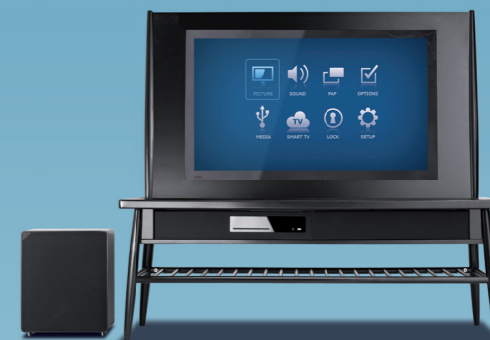
2012 De geboorte van de eerste tv, geluidsinstallatie en meubel in één