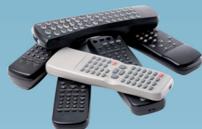
1955 Uitvinding van de afstandsbediening