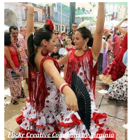
Flickr Creative Commons by Marinaia

Elke namiddag tijdens de Ferias, vanaf 14u, toveren de Malagueños hun stad om tot een paradijs vol muziek en plezier. Het historische centrum van de stad bruist van het leven en is dé ideale ontmoetingsplaats voor jong en oud. Laat je verleiden door de verschillende standjes, 'casetas', die wijn en tapas aanbieden. Of aanschouw de 'Sevillanas', de traditionele dans van Málaga, die door elke fiere inwoner in een traditionele outfit en vol overgave wordt uitgevoerd. Rond 20u komt er een einde aan deze feestvreugde, dan veegt men de straten schoon. De lokale bevolking trekt dan naar huis om zich klaar te maken voor het avondfeest. Ideaal dus om je even op te frissen en iets te eten.