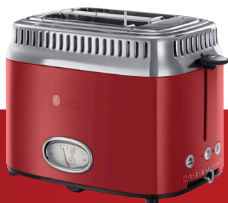
Retro Ribbon Red 21680-56