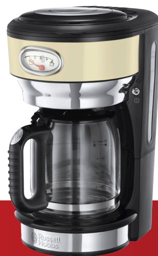
Retro Vintage Cream 21702-56