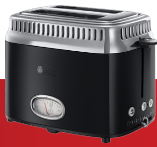
Retro Classic Noir 21681-56