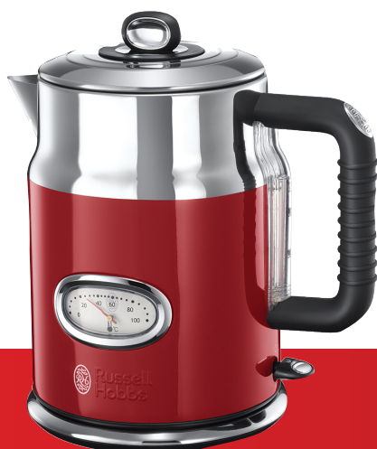
Retro Ribbon Red 21670-70