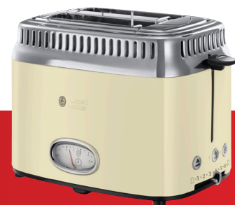
Retro Vintage Cream 21682-56