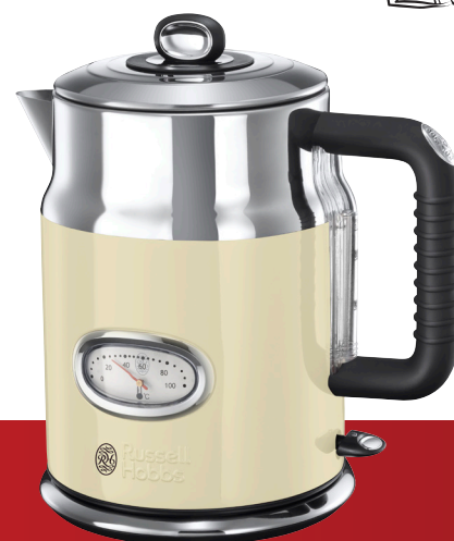
Retro Vintage Cream 21672-70