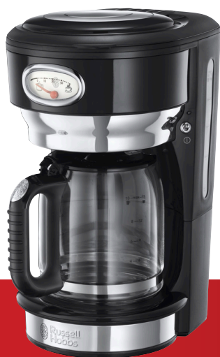
Retro Classic Noir 21701-56