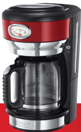
Retro Ribbon Red 21700-56