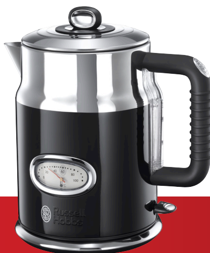
Retro Classic Noir 21671-70