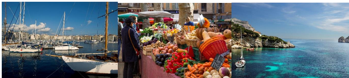
De oude haven (Le Vieux Port) in Marseille - Markt in Aix-en-Provence

Genoeg van de winter? Dan is het hoog tijd om de zomervakantie te boeken. Met de Zon-Thalys brengt Thalys reizigers elke zaterdag van 24 juni tot 26 augustus naar de zonovergoten steden Valence, Avignon, Aix-en-Provence en Marseille. Begin al maar te dromen van een vakantie in Zuid-Frankrijk, want tickets zijn beschikbaar vanaf donderdag 9 februari. Geen file, stress of vermoeidheid, maar in de plaats genieten van een snelle en comfortabele reis aan boord van de Zon-Thalys.