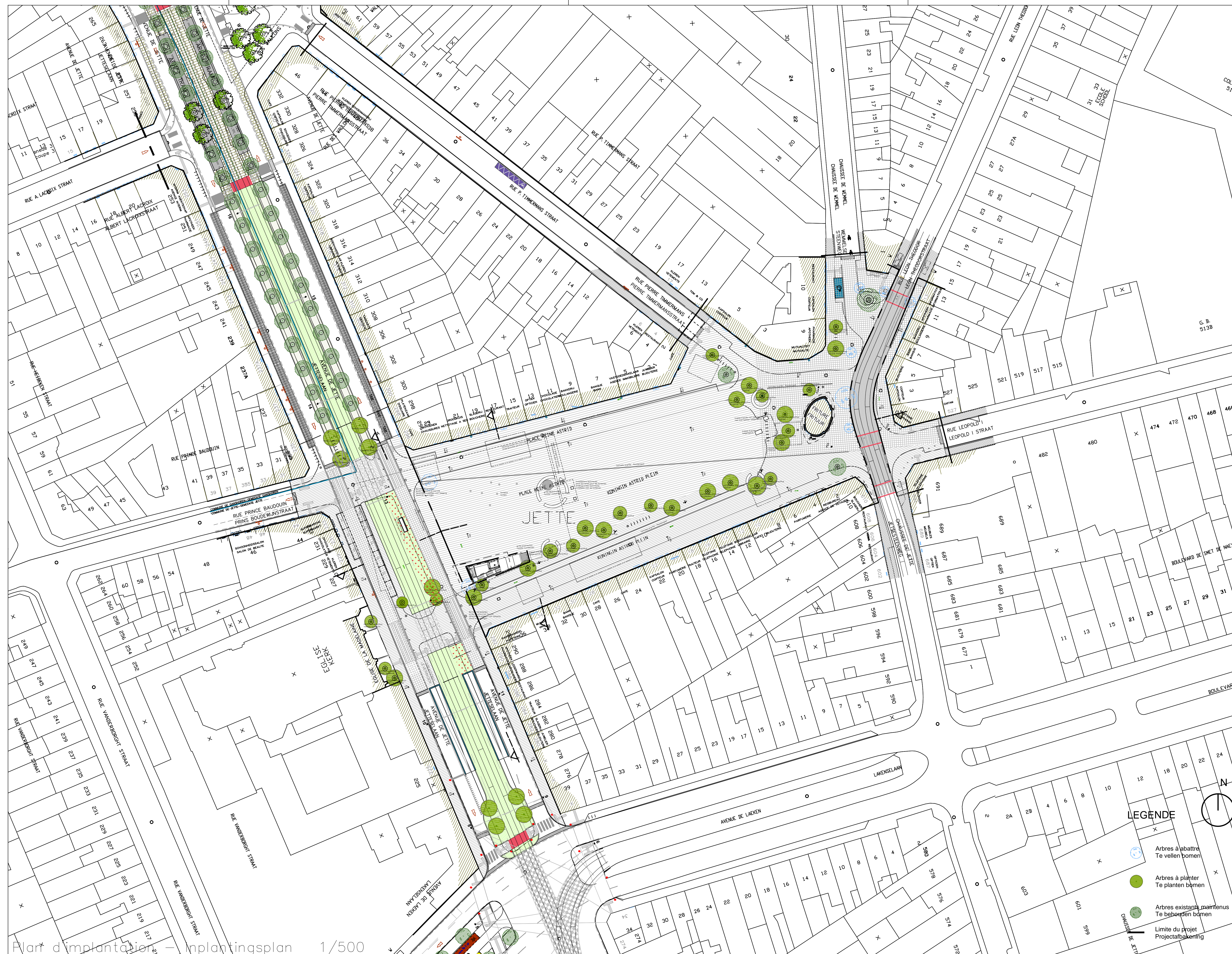
Plan d'implantation – Inplantingsplan 1/500