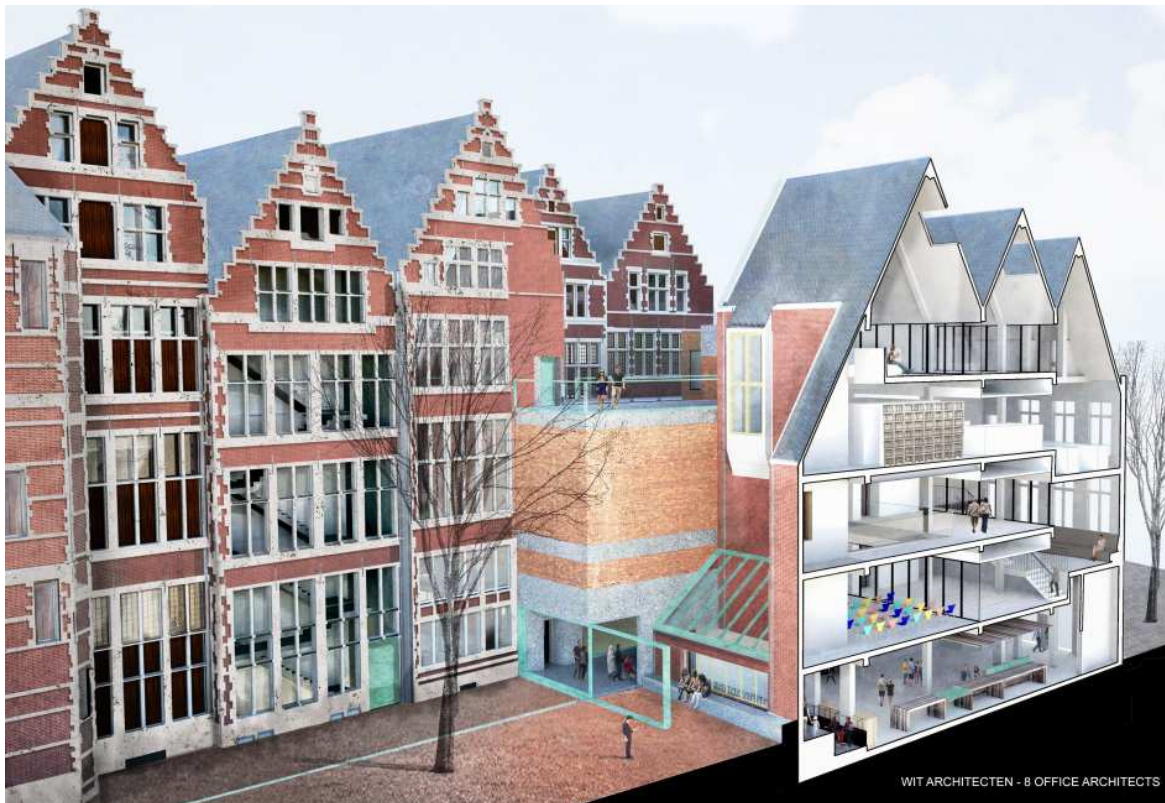
Foto: doorsnede zijaanzicht DIVA © DIVA / TV WIT architecten – 8 office architects