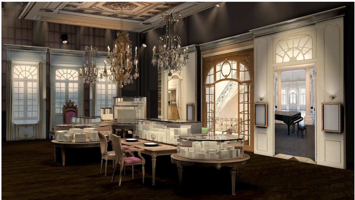
Foto: Diva's Eetkamer (door Carla Janssen Höfelt) © DIVA / Carla Janssen Höfelt / Foto Dave Thompson