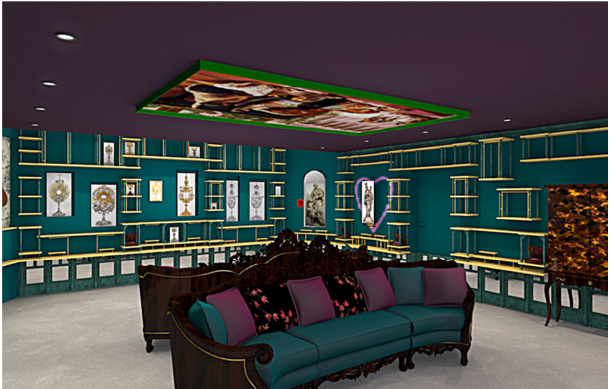
Foto: DIVA's Wonderkamer (door Gert Voorjans)