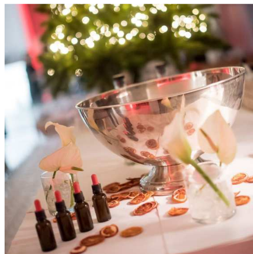
Foto: Museumshop Silvius Druon Foto: Events bij DIVA