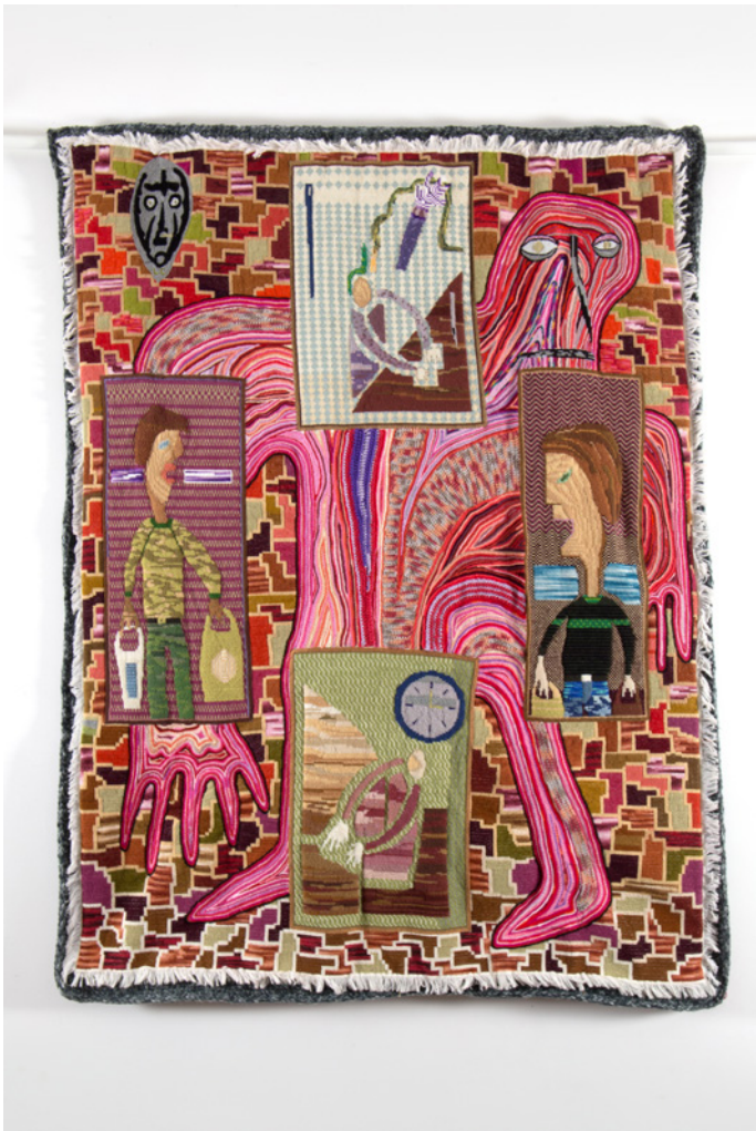
Klaas Rommelaere, 'Time Management', 2018