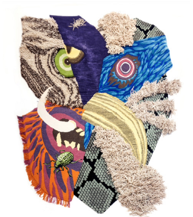
Christoph Hefti, 'Animal Mask', 2016