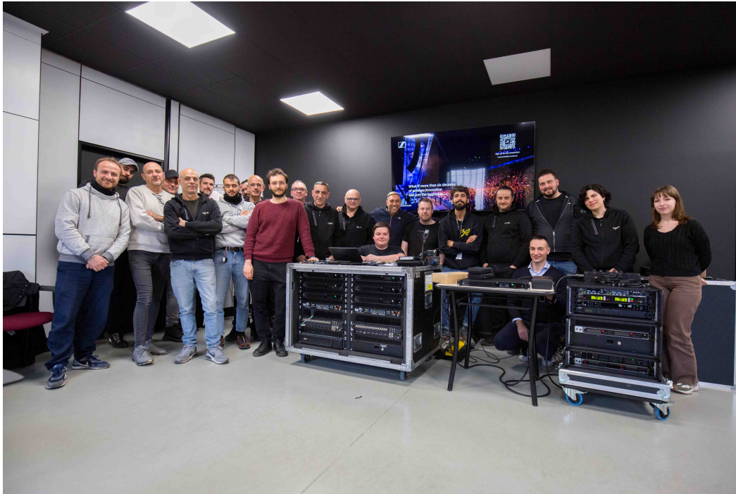
L'équipe d'Agorà a approfondi la technologie large bande et Spectera

Les images haute résolution accompagnant ce communiqué de presse ainsi que des photos supplémentaires peuvent être téléchargées ici .