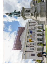
Opéra Royal de Wallonie