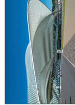
Gare TGV Liège-Guillemins