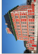
Musée Grand Curtius