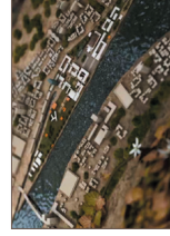
Eco quartier Coronmeuse