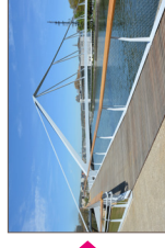
La Belle Liégeoise