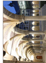
Musée de la Vie wallonne