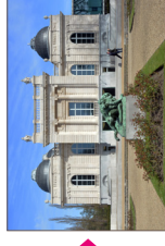
Musée de La Boverie