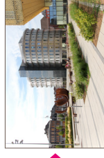
Seraing bd urbain et centre