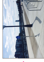
Quais de Meuse