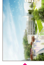
Business Park "Val Benoît"