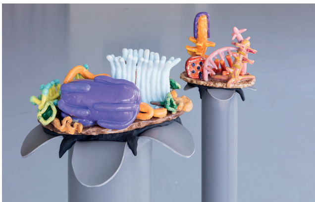
Antoinette d'Ansembourg, Minimondes 2205 et 2202 , fototentoonstelling, Out of order, Pilar ULB, Brussel, 2023, Foto: Silvia Cappellari

Een uitstalraam voor in-situ -projecten van Brusselse kunstenaars, geselecteerd na een projectoproep