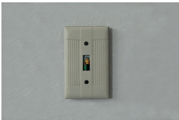
Sabrina Montiel-Soto, Il est parti en éteignant la lumière , 2009, stof, plastiek