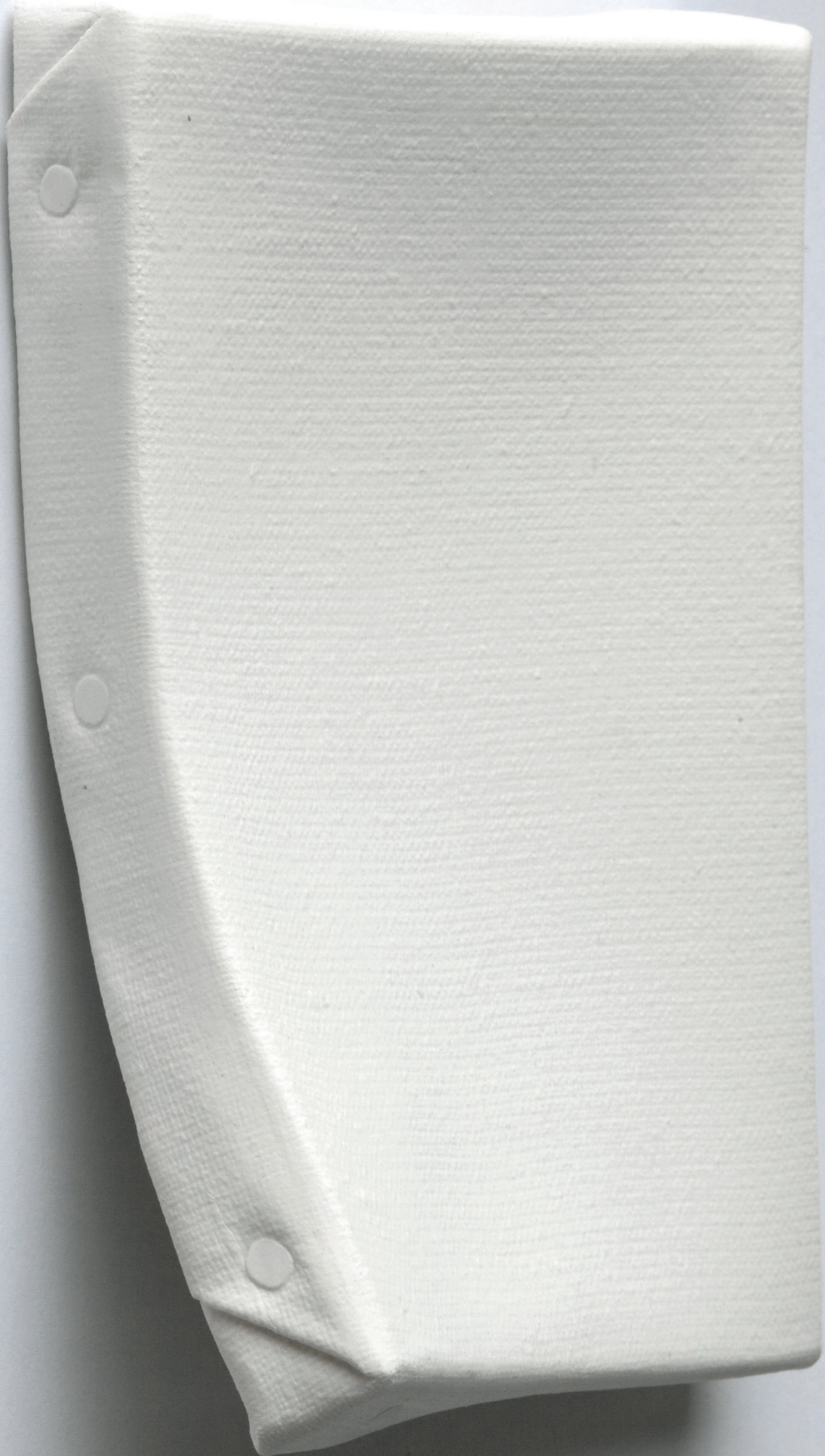
Stephan Balleux, White Canevas (with a twist) , 2010, porselein