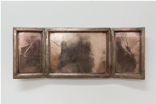
Marco De Sanctis, Le Menteur (The Liar) , 2022, gemengde techniek / brons