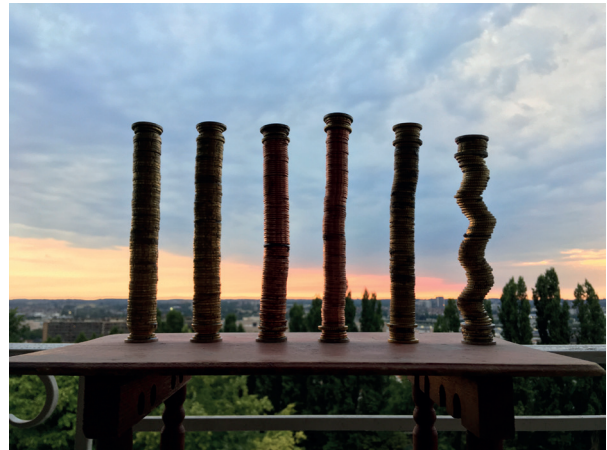
Damien De Lepeleire, Homeless Barocco , 2018