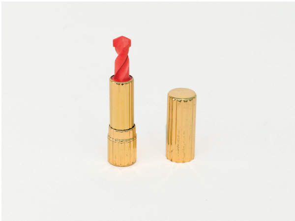
Etodie Antoine, Lipstick , 2015