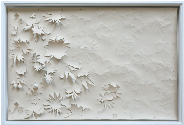
Gudny Rosa Ingimarsdottir, wallpaper , 2018, uitgesneden behang en stiksels op papier