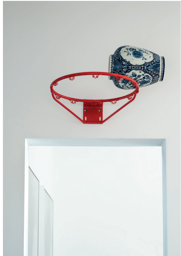
Nicolás Lamas, Paroxysm , 2018