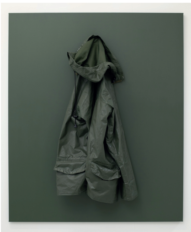
Leon Vranken, Partly Cloudy , 2021, acryl op canvas en PVC regenjas