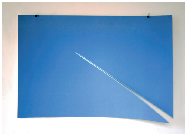
Benoît Felix, À la lettre (une ligne dans le ciel) , 2011, gespleten fotolithografie, Bruno Robbe edities