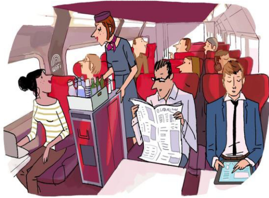
Premium : le meilleur de Thalys.

Avec cette nouvelle gamme, Thalys réaffirme son pari d'un service d'excellence pour les clients business et fréquents.