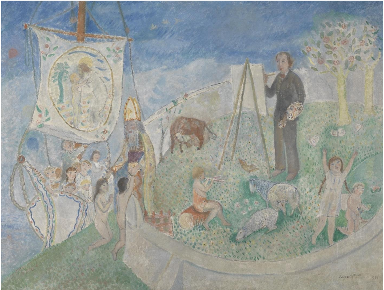
Edgard Tytgat, Uitnodiging tot het paradijs, 1922, dit schilderij is eigendom van de Vlaamse Overheid, in langdurig bruikleen aan het MSK Gent