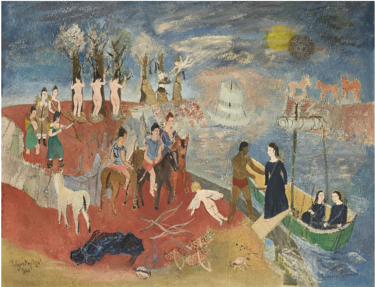
Edgard Tytgat, Bladzijde uit een droomnacht van een novice en van haar twee dienstmeiden , 1954

Ook mythes zijn een inspiratiebron, zoals het verhaal van Iphigeneia. In het schilderij ' Bladzijde uit een droomnacht van een novice en haar twee dienstmeiden ' past Tytgat een andere verteltechniek toe, namelijk het continu narratief. Op één doek zie je verschillende scènes. Zo volg je een novice en haar dienstmeiden die aan wal komen met een bootje. Wat volgt is eerder een nachtmerrie dan een droomnacht. De vrouwen worden uitgekleed en achteraan terechtgesteld. Deze techniek werd vaak gebruikt in de middeleeuwen, maar raakte op de achtergrond vanaf de renaissance. Toen moest de schilderkunst een realistische blik geven op de wereld. Het is net die rationele aanpak die niet bij Tytgat past. Hij kiest voor een eeuwenoude beeldstrategie en past die toe op een scène die aan zijn fantasie ontsproot.