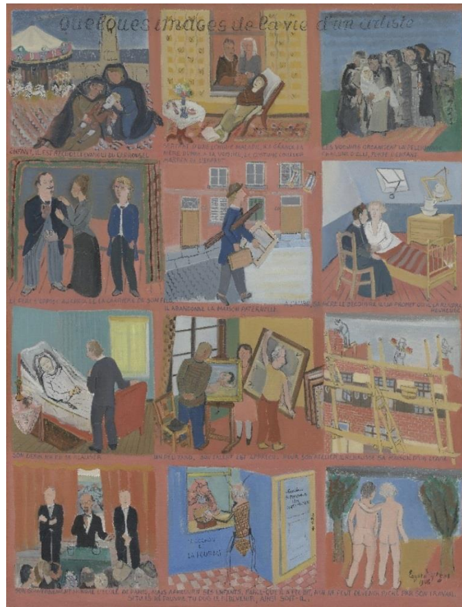
Edgard Tytgat, Enkele beelden uit het leven van de kunstenaar , 1946