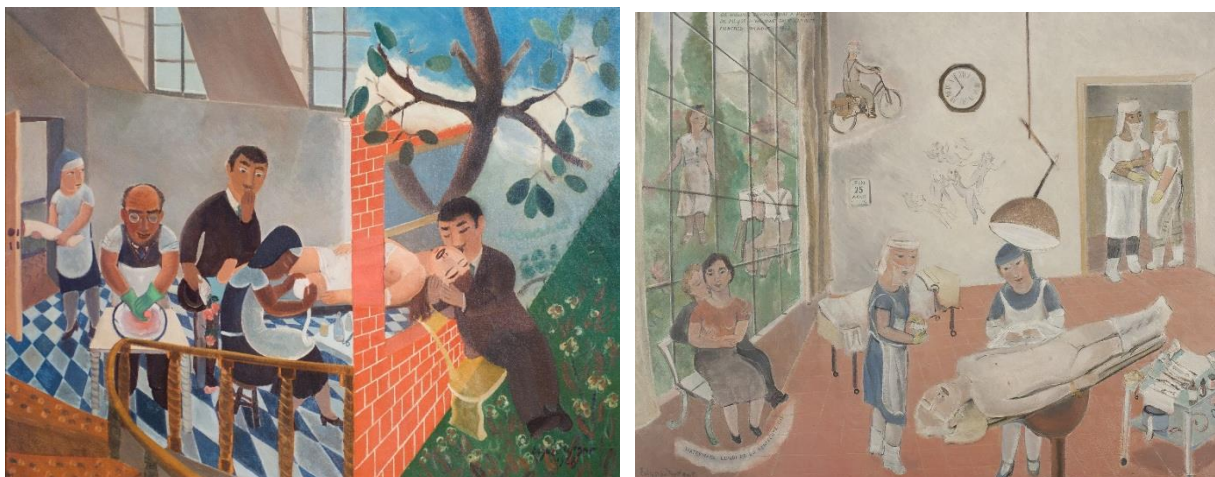
Links: Edgard Tytgat, Voorspel van een gebroken liefde , 1928 – Rechts: Gevolg van een onderbroken wandeling , 1939

De filmische kwaliteiten van Tytgat komen mooi naar voren in 'Voorspel van een gebroken liefde'. Hij bouwt zijn verhaal op met een synoptisch narratief. Zo is het beeld verdeeld in twee helften. Een romantisch en een luguber tafereel. Links zie je een operatiekwartier waar het been van een vrouw wordt afgezet. Een jonge man kijkt met afgrijzen toe. Diezelfde man komt ook rechts in beeld terug. Daar houdt hij liefdevol het hoofd van de slapende vrouw vast. Of het om dezelfde vrouw gaat, kunnen we alleen maar raden.