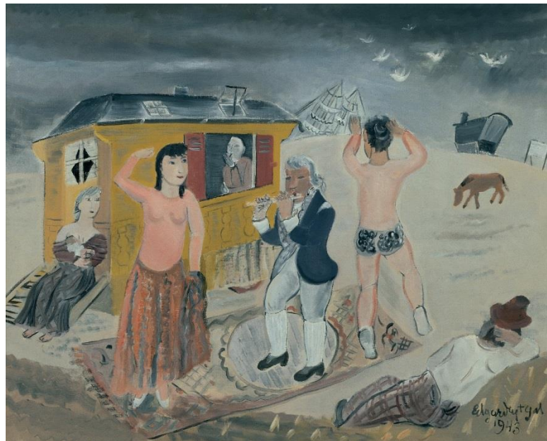
Edgard Tytgat, Mozart en de bohemers, 1943

De meeste van Tytgats circus-en kermistaferelen zijn erg bevolkt. Alle mensen samen lijken een onschuldig harmonisch geheel. Wie goed kijkt, ziet Tytgat als toerist in zijn eigen werk terugkomen. Je ziet hem op wandel, noterend in een boekje of gluren op de tribune. Deze werken gaan dus meer over Tytgats kijken dan over een circusnummer of violist. Het gaat over kijken en bekeken worden.