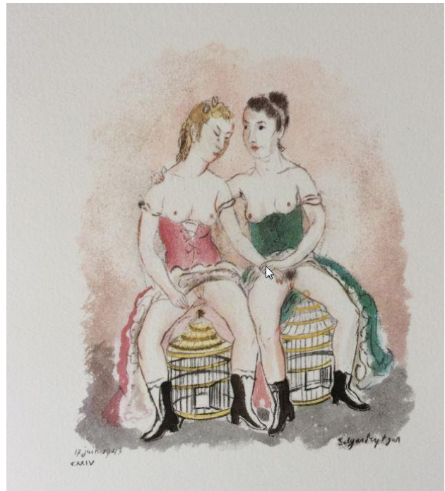
Edgard Tytgat, Huit dames et un monastère (1941-1947)