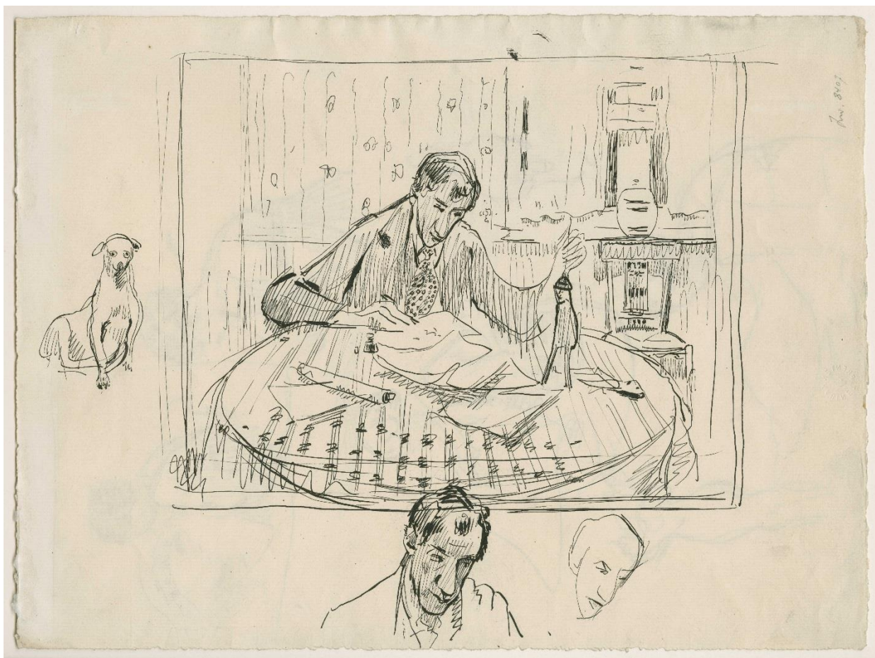
Rik Wouters, Tytgat aan tafel, ongedateerd

Op 28 april 1879 kwam Edgard Tytgat ter wereld. Kort daarna verhuizen zijn ouders van Brussel naar Brugge. Zijn kindertijd wordt getekend door een val van een kernismolen, waarvan hij maar moeizaam herstelt. In 1888 keert de familie terug naar Brussel, de stad waar hij tot zijn dood zal blijven wonen. Daar gaat hij als veertienjarige in de leer bij een horlogemaker en daarna in het lithografisch atelier van zijn vader. Vanaf 1897 volgt hij avondles aan de Academie voor Schone Kunsten in Brussel, zet hij zijn eerste stappen in de kunstwereld en wordt hij goede vrienden met kunstenaar Rik Wouters.