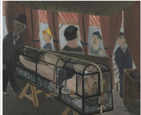
Links: Fantasie, Marionetten en Landschap , 1912 – Rechts: Jong meisje in een glazen doodskist , 1932

De meeste van Tytgats circus-en kermistaferelen zijn erg bevolkt. Alle mensen samen lijken een onschuldig harmonisch geheel. Wie goed kijkt, ziet Tytgat als toerist in zijn eigen werk terugkomen. Je ziet hem op wandel, noterend in een boekje of gluren op de tribune. Deze werken gaan dus meer over Tytgats kijken dan over een circusnummer of violist. Het gaat over kijken en bekeken worden.