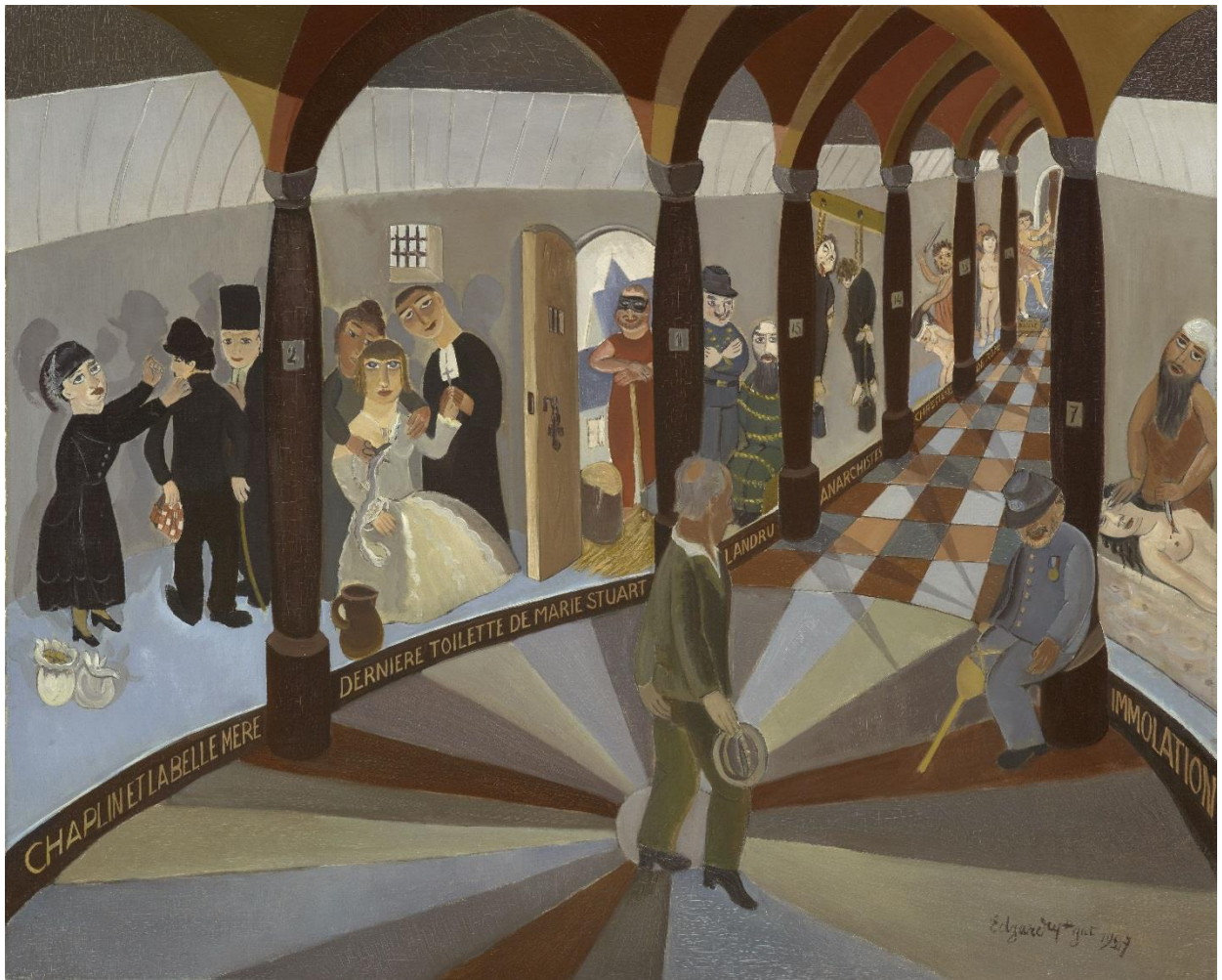
Edgard Tytgat, Tytgat en de wassenbeelden , 1927