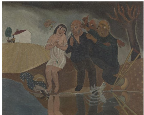
Links: Edgard Tytgat, Edgard Tytgat, Voorspel van een geboorte, 1932 Rechts: De tragische grijsaards, 1924, privécollectie

In het schilderij 'Voorspel van een geboorte' past Tytgat het monoscenisch narratief toe. Er wordt één scène afgebeeld, die zich op één plek en op één moment in de tijd afspeelt: de vlucht van Maria en Jozef uit Egypte. Maar een letterlijke weergave hoef je niet te verwachten. Jozef heeft een paraplu in zijn handen en Maria ziet eruit als een boerin. De titel suggereert de rest. Het is Jozef die de zwangere Maria op een ezel begeleidt en met zijn arm haar zwangere buik beschermt. Tijdens die vlucht wordt Jezus geboren.