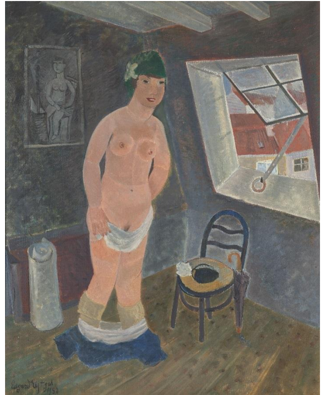
Links: Edgard Tytgat, De laatste pop , 1923, Rechts: Meisje op mansarde , 1950

Een andere techniek is het gebruik van een beeld in een beeld. In het schilderij Euphrasie poseert voor de eerste maal zie je niet alleen een jong meisje dat naakt op bed ligt. Rechts van haar zie je aan de muur het schilderij 'voorspel van een geboorte' hangen. Het werk is een schilderij van Tytgat dat hij in 1940 schilderde. Hiermee wordt de eerste keer poseren voor Euphrasie al een pak minder onschuldig. Bovendien voegt hij nog een extra methode toe door te verwijzen naar een bekend kunstwerk. Zo doet de houding van Euphrasie denken aan beroemde naaktportretten, zoals de Olympia van Manet of de Venus van Urbino van Titiaan. En die verwijzing ontnemt meteen al haar onschuld, aangezien beide kunstenaars met prostituees als modellen werkte.