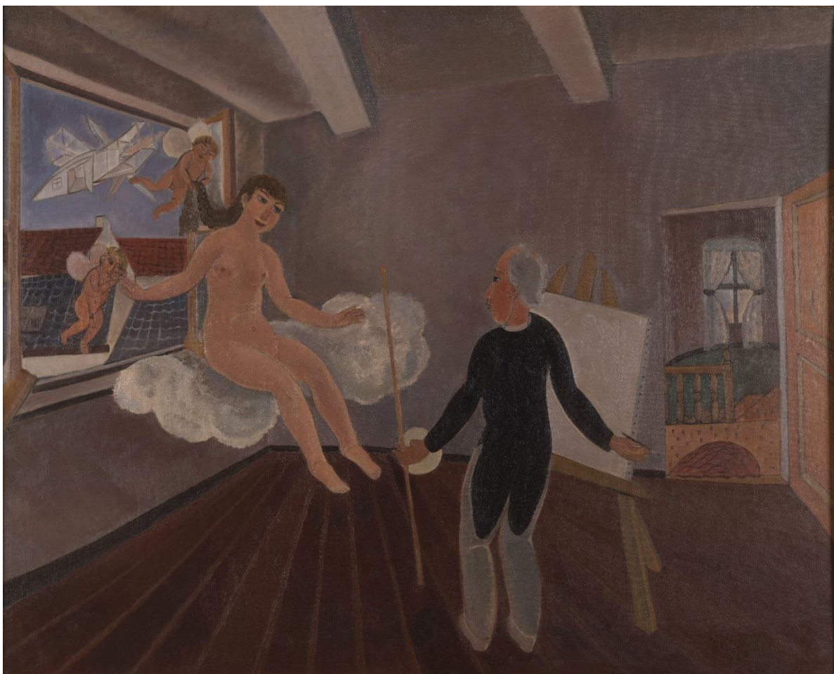
Edgard Tytgat, Inspiratie , 1926 © Antwerpen, The Phoebus Foundation

Zijn eigen leven was zijn grootste inspiratiebron. Dat maakt zijn oeuvre ook sterk biografisch. Alle thema's werden geschilderd vanuit zijn eigen huis. Met scènes en personages uit zijn eigen leven. Zoals zijn echtgenote, Maria Tytgat. Het schilderij Inspiratie toont de kunstenaar in