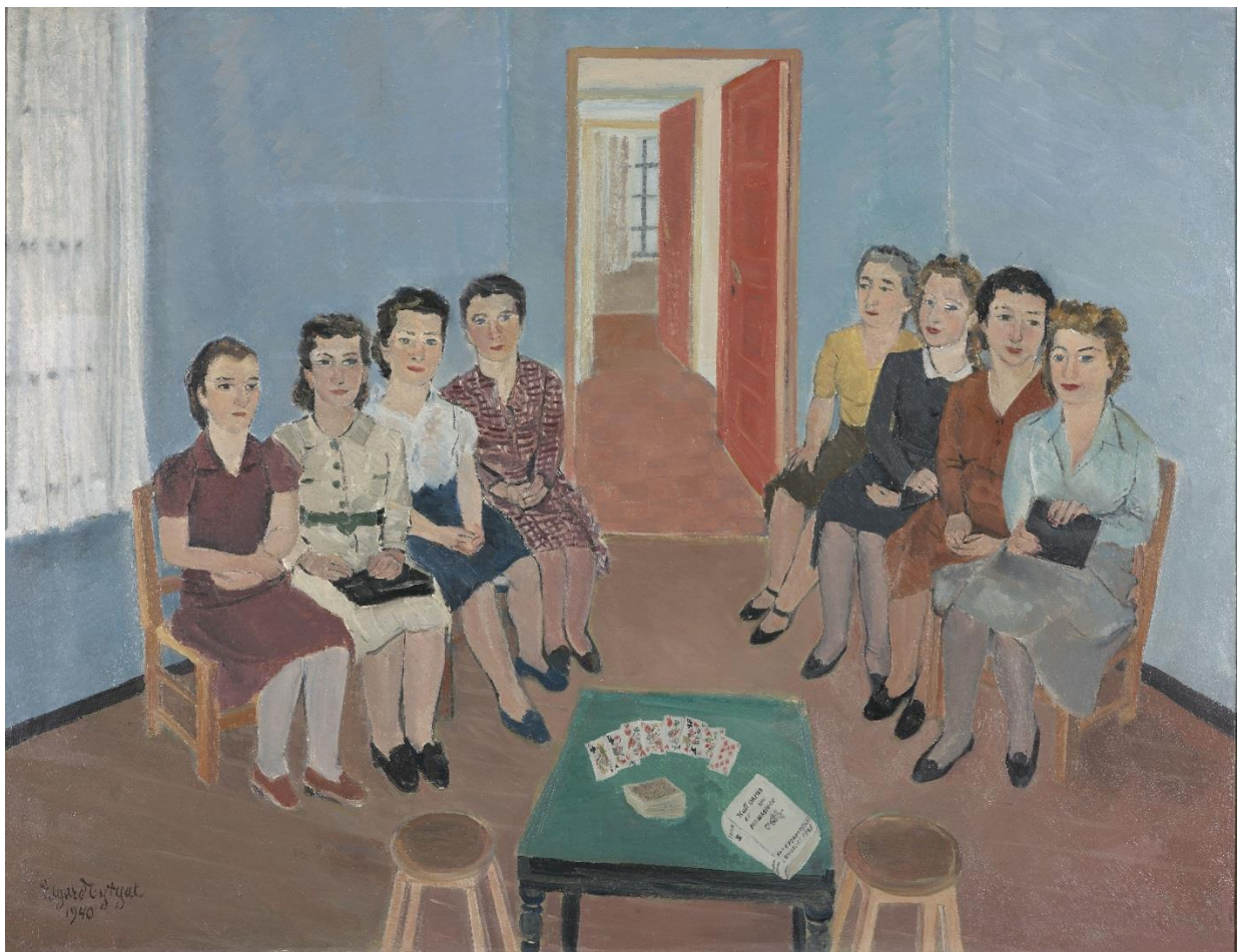
Edgard Tytgat, De acht dames , 1940