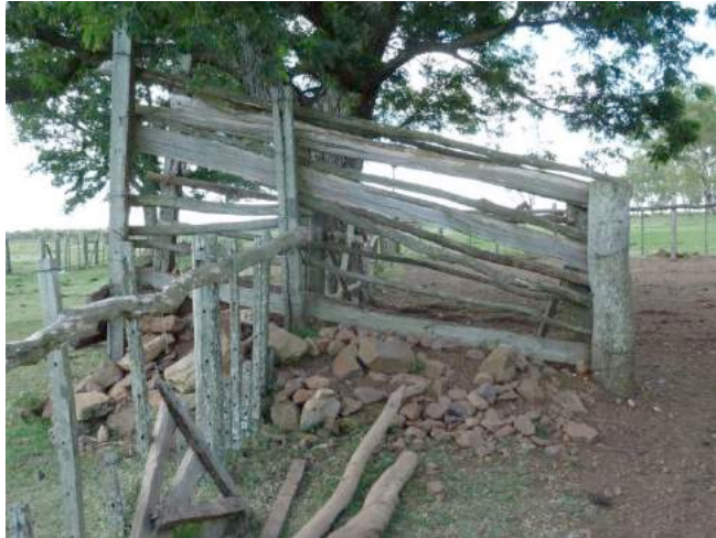
De loskade ligt er erg verwaarloosd bij.