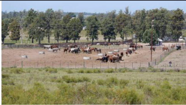
Verzamelplaats Clay: een kraal zonder enige vorm van beschutting