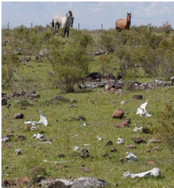
Op de grond liggen beenderen.