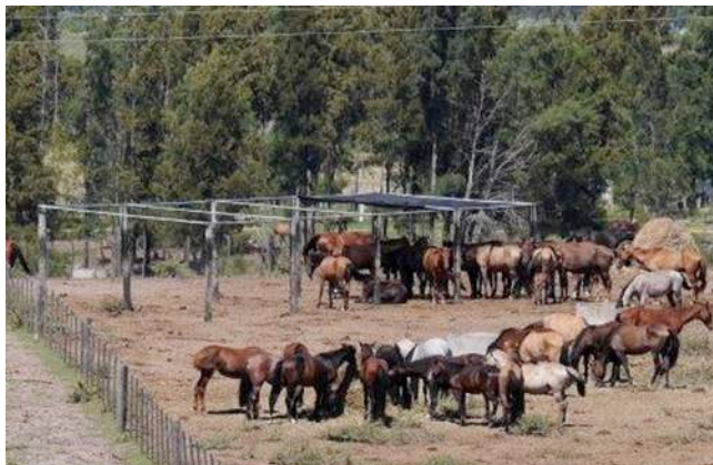
Een vervallen afdak biedt onvoldoende schaduw voor alle paarden.

Om 14 uur komt een vrachtwagen het slachthuisterrein op gereden. De oude, gammele wagen rijdt achterwaarts tot tegen de loskade. Het kwik loopt op tot boven de 30°C, terwijl het open dak van de trailer geen enkele bescherming biedt tegen de felle zon. De wagen zit overvol. Geen enkel paard draagt oormerken, wat bij ons de vraag doet rijzen waarom de paarden bij het slachthuis worden afgeleverd, en niet op de verzamelplaats, waar eveneens een loskade is voorzien. In Uruguay kunnen immers alleen paarden met oormerken legaal worden geslacht.