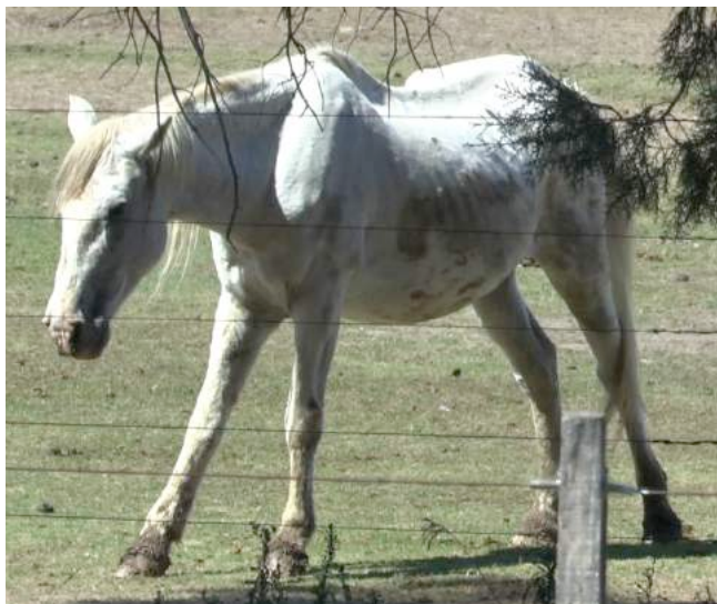
Abnormale houding ten gevolge van pijn