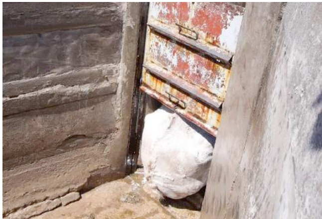
Een paard glijdt uit in de drijfgang en valt.