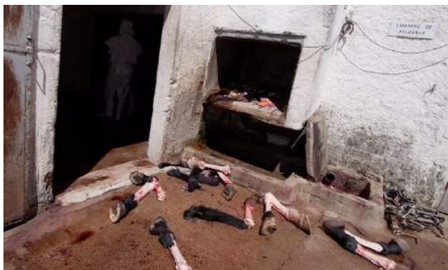
Afgehakte paardenbenen vallen op de vloer van de binnenplaats