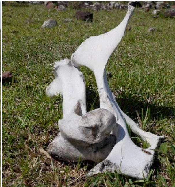
Een dijbeen en een halve heup van een paard