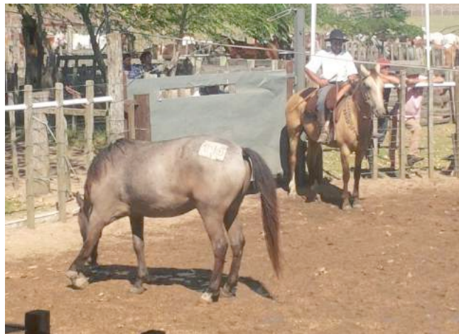
Een paard met gebroken vetlok wordt geveild.