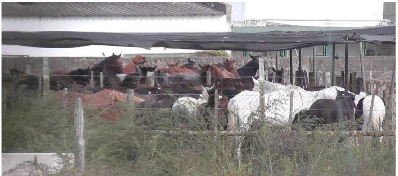
De overvolle kralen van het slachthuis Lamar