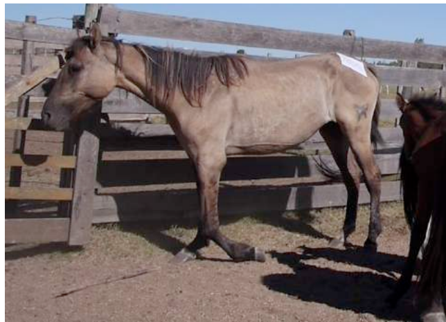
Een paard met een gebroken been vooraan steunt op slechts drie benen.