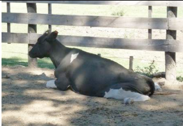
Niemand kijkt om naar een gevallen koe..