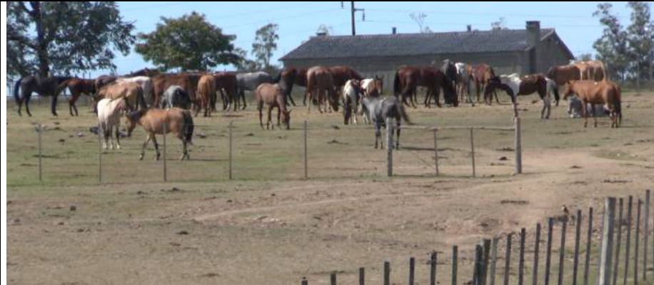
Paddock waar amper gras groeit en waar geen schaduw is.