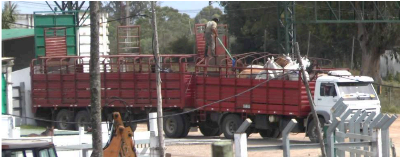
Terwijl de paarden worden gelost, gaan medewerkers bovenop de transportwagen staan, wat de paarden bang maakt.