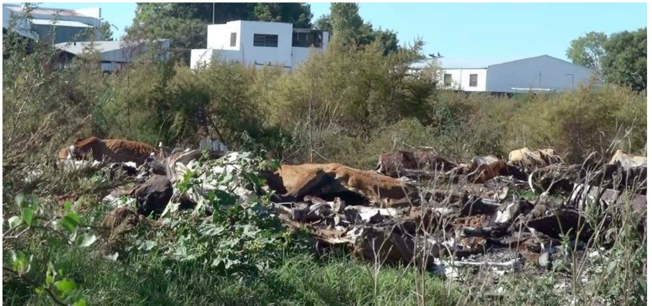
Een stapel dode paarden naast het slachthuis Entre Ríos