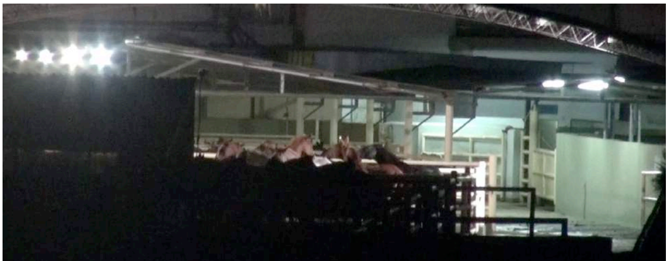
Overvolle kralen in het slachthuis Lamar