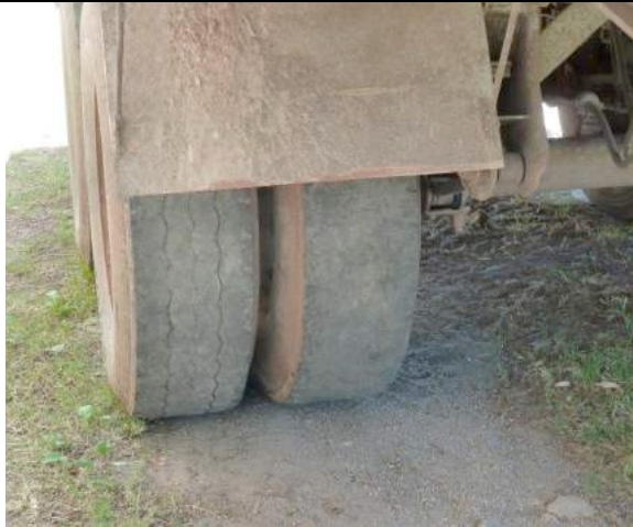
Een versleten band zonder profiel