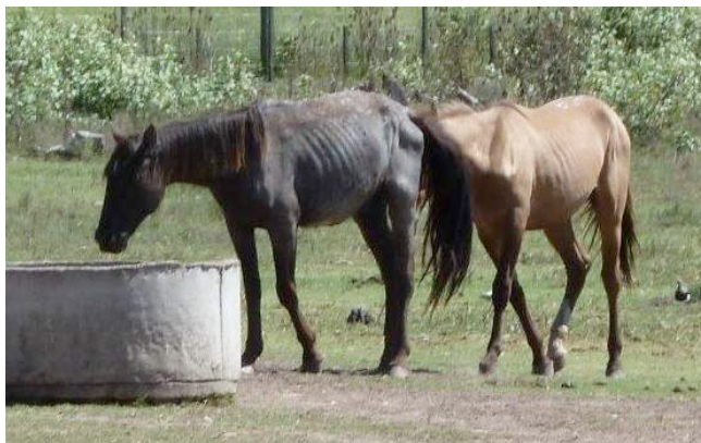
Een uitgemergelde, verzwakte ruïn zonder oormerk