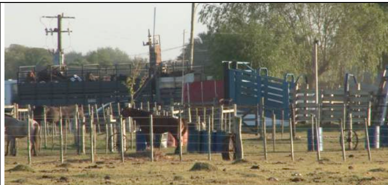
De meeste paarden worden pas de dag na de veiling ingeladen.