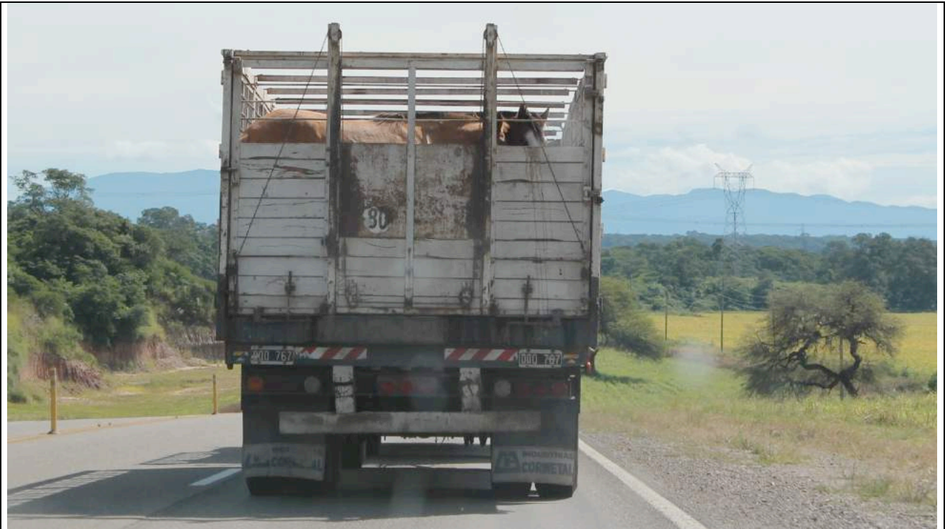
Een typische Argentijnse transportwagen die geen bescherming biedt tegen weersomstandigheden