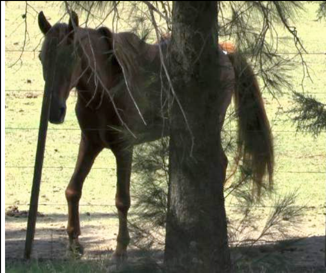
Een paard met een gezwollen carpaal gewricht, steunend op drie benen