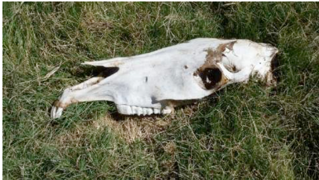
Op de weide van het slachthuis ligt een paardenschedel zonder kogelgat.

waardoor ze achteruitdeinzen in plaats van vooruit te gaan. De vloer van de drijfgang is glad. Een wit paard glijdt uit en raakt maar moeilijk rechtop. Het lawaai van de slachtvloer weerklinkt luid. De paarden in de drijfgang zijn duidelijk erg bang of zelfs in paniek. Vooraan de lijn worden de paarden systematisch met een stroomstok het gebouw ingejaagd. Volgens de beheerder van het slachthuis worden de paarden met een stroomstoot op het hoofd verdoofd. Waarschijnlijk krijgen ze daarom vooraf water in het gezicht gespoten. Heel wat paarden zijn er heel erg aan toe. Sommige dieren zijn uitgemergeld of hebben open wonden en schaafwonden aan hun lichaam en hoofd. Eén paard heeft een bloedende wonde langs de ruggengraat. Een groot deel van deze verwondingen liepen de dieren waarschijnlijk op tijdens het transport. Bovendien zien we verscheidene paarden zonder oormerken. Dit is in strijd met de Uruguayaanse wetgeving, die stelt dat paarden zonder oormerken niet mogen worden geslacht.