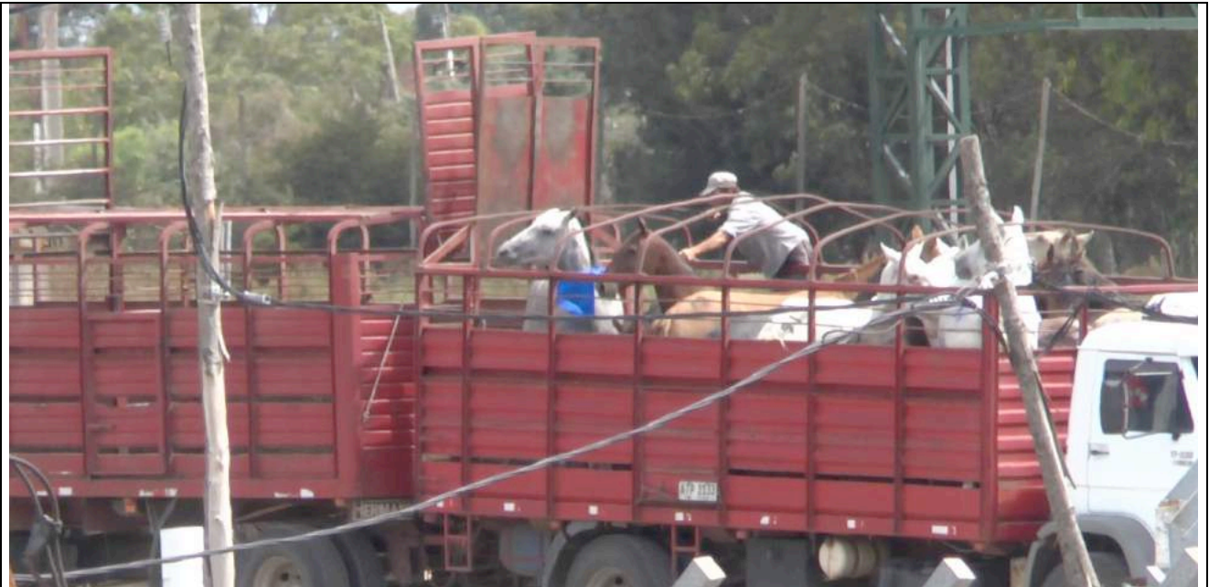
De paarden moeten onder de veel te lage valdeuren door.