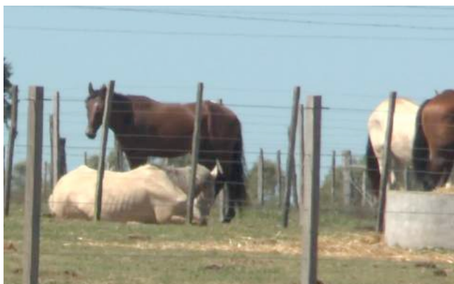
Een mager paard ligt neer en ziet er uitgeput uit.