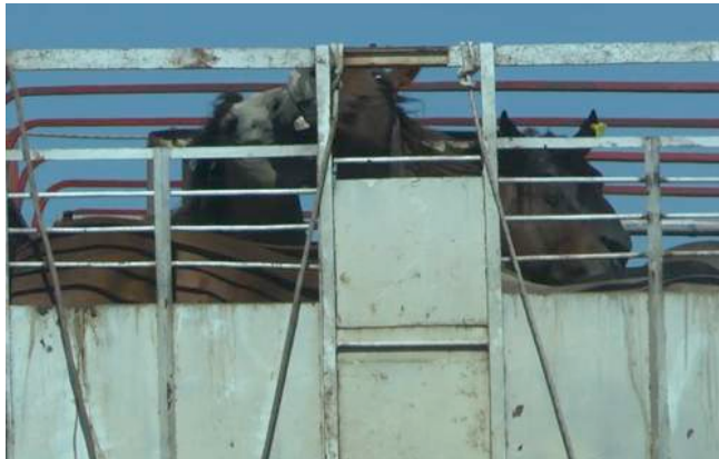
Vechtende paarden in de overvolle aanhangwagen

's Morgens volgen we een transportwagen vol paarden die langs Clay passeert op weg naar het slachthuis Sarel. Het is een typisch Uruguayaanse transportwagen, zonder dak en dus zonder beschutting tegen de zon of de regen. De aanhangwagen lijkt overvol te zitten, en we zien hoe heel wat paarden elkaar bijten. Bij Sarel zelf grazen paarden in de paddocks naast de hoofdweg. Er is stro voorzien en ze kunnen ook een klein beetje gras eten. De paarden kunnen echter geen schaduw opzoeken. Een mager paard met duidelijk zichtbare ribben en heupbeenderen ligt neer en lijkt uitgeput. 's Namiddags volgen we een andere transportwagen met paarden op weg naar het slachthuis Sarel. De dieren staan opeengepakt en het metalen traliewerk boven hun hoofden hangt erg laag, waardoor grote paarden hun hoofd kunnen stoten.