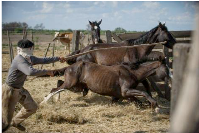
Op de verzamelplaats in La Banda worden paarden ingeladen. (foto 2012)

voor het transport, de administratie en de transacties met de slachthuizen. We kennen de handelaar van een voorgaand onderzoek en willen het risico niet nemen om hem nogmaals te ontmoeten, want hij zou ons ongetwijfeld herkennen. In 2012 bezochten we de verzamelplaats in La Banda, van waar we een vrachtwagen volgden tijdens de 18 uur durende rit naar het slachthuis Lamar. De hele rit lang moesten de paarden het stellen zonder water of voedsel. De omstandigheden op het verzamelpunt waren ronduit rampzalig: geen beschutting, geen water, uitgemergelde en gewonde paarden, geen medische verzorging, honden en stokslagen om de paarden bijeen te drijven.