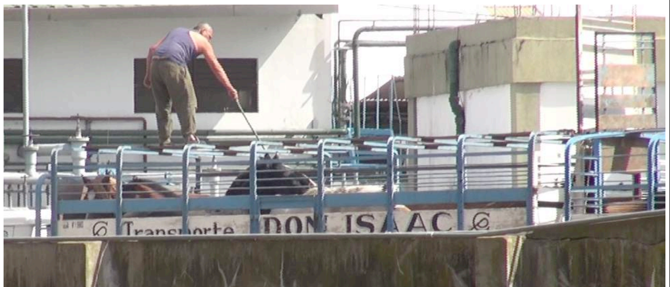
Een slachthuismedewerker slaat een van de paarden op het hoofd.

Wanneer we 's middags aankomen bij het slachthuis Lamar zien we hoe een transportwagen het terrein oprijdt en de paarden worden gelost. Het is een typisch Argentijnse transportwagen, met open dak en valdeuren die veel te laag zijn voor paarden. Een van de slachthuismedewerkers gaat bovenop de trailer staan en slaat de dieren met een stok op het hoofd. Meerdere paarden stoten hun hoofd hard tegen de lage valdeuren, wat ernstige hoofdwonden kan veroorzaken. Terwijl de paarden naar de kralen worden gedreven, glijdt een wit paard uit in de drijfgang. Een bruin paard loopt erg mank en heeft het moeilijk om de andere paarden bij te houden. Tal van paarden zijn graatmager, met duidelijk zichtbare ribben en heupbeenderen. De dieren worden naar een veel te kleine en overvolle kraal geleid. De ruime paddocks achter de kralen liggen er overwoekerd en onbegraasd bij. Vroeger verbleven de paarden verscheidene dagen in deze paddocks voor ze werden geslacht. In 2013 werden hier veel gestolen, zwaargewonde en stervende paarden aangetroffen. Het lijkt erop dat de paarden vandaag alleen nog in de kleine kralen naast het hoofdgebouw gehouden worden waar ze beter afgeschermd zijn voor ongewenste blikken.