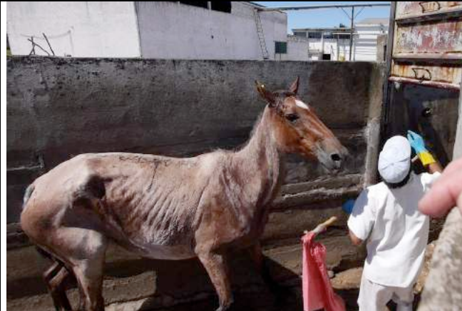
Dit graatmager paard is duidelijk erg angstig.