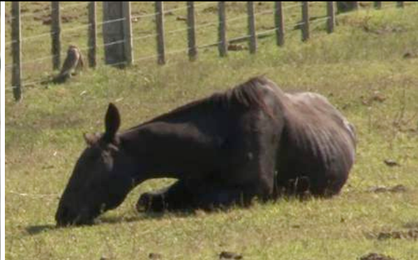
Een paard houdt zijn achterbeen omhoog uit pijn. Een uitgeput en mager paard ligt op de grond.