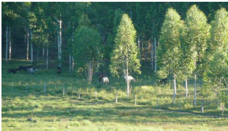
Paarden grazen langs de rand van een eucalyptusbos.

's Morgens brengen we een bezoek aan de verzamelplaats van paardenhandelaar Bardanca, die aan de drie door de EU-erkende paardenslachthuizen levert. Hij is een van de voornaamste leveranciers van Clay en leverde er in 2014 meer dan 1.300 paarden. Bardanca huurt een terrein van een internationaal bosbedrijf in Tranqueras, in Noord-Uruguay. Bij onze aankomst zien we lege kralen en een loskade. Het water in de trog is erg vuil en zit vol algen. In de weide achter de kralen zien we een tiental paarden langs de bosrand. Waarschijnlijk lopen er nog meer paarden in de eucalyptusplantage, uit het zicht. Later krijgen we te horen dat Bardanca bekend staat als de grootste paardensmokkelaar van Uruguay. Een ambtenaar weet ons te vertellen dat de familie Bardanca al generaties lang paarden smokkelt en de dieren zonder problemen over de Braziliaans-Uruguayaanse grens krijgt.