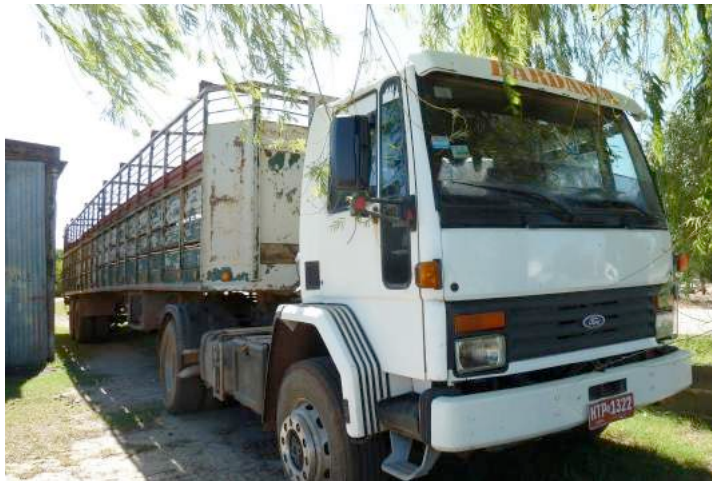
De gammele aanhangwagen hangt aan een stuurcabine waarop "Bardanca" te lezen staat.