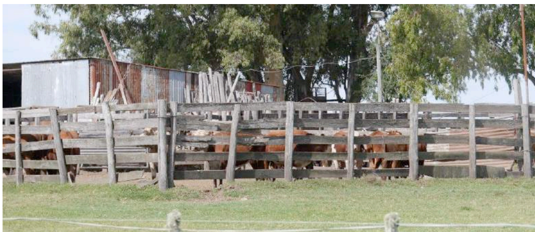
De verzamelplaats van Pedrazzi, de voornaamste leverancier van het slachthuis Clay

Als we Pedrazzi's medewerkers vragen of ze paarden te koop aanbieden, antwoorden ze ons dat ze slechts over enkele rijpaarden beschikken die niet te koop zijn. Over de paarden die bij het vee in de kralen staan, zeggen ze ons niets. Het lijkt erg aannemelijk dat die paarden in het slachthuis zullen belanden.