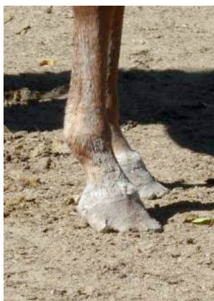
Paard met onverzorgde hoeven