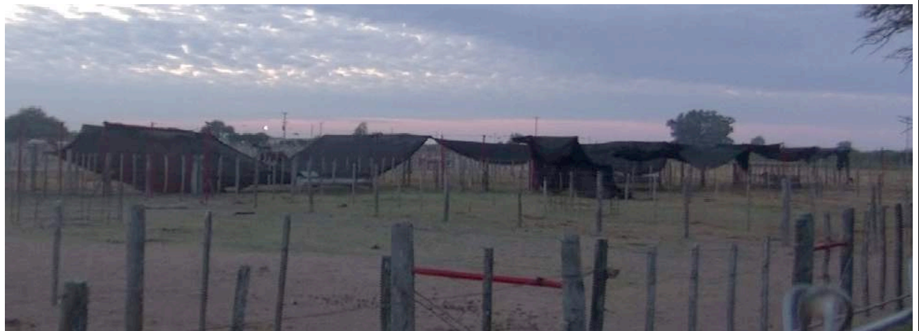
Sommige weiden beschikken over een vervallen afdak. Op andere weiden is helemaal geen beschutting voorzien.