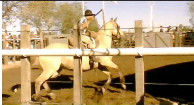
Een rijpaard wordt door de ring gejaagd.