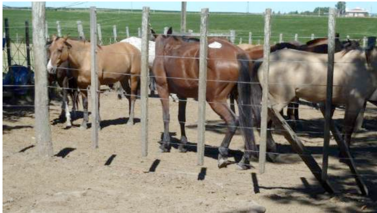
Een van de paarden draagt nog een veilingnummer van een voorgaande veiling.

Een transportwagen is net aangekomen en er wordt één paard uitgeladen, met bloedende snijwonden aan het hoofd en één van de achterste benen. Wanneer het paard uit de wagen is, raapt een medewerker de hoefijzers in de aanhangwagen op. Die moeten afgefallen zijn tijdens voorgaande ritten. Het feit dat grote groepen paarden met hoefijzers worden vervoerd zonder tussenschotten in de wagen vormt een bijzonder groot risico op verwondingen. In een van de kralen ligt een koe op de grond, met gespreide achterpoten. Het dier kan duidelijk niet meer alleen rechtop komen. De koe heeft waarschijnlijk een gebroken bekken of gescheurde liesspiieren. Niemand kijkt om naar het dier, terwijl het dringend medische verzorging nodig heeft.