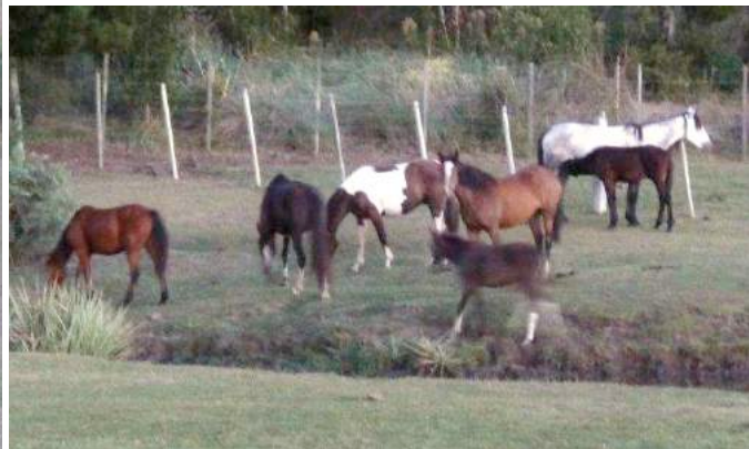
Merries en veulens worden samen vervoerd.