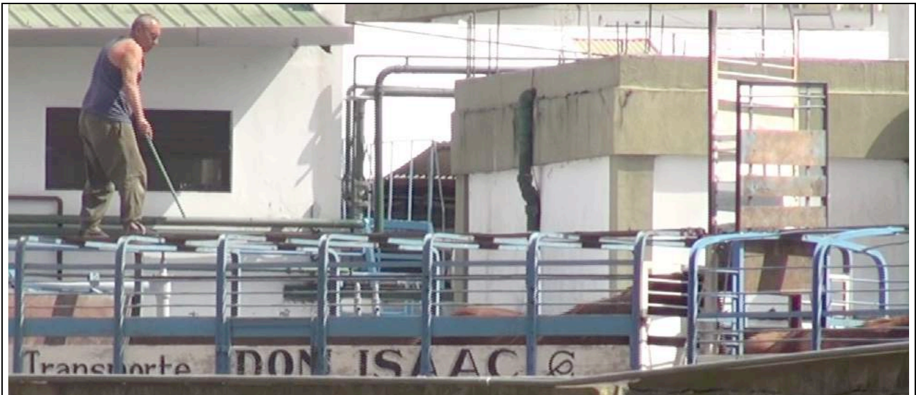
Een van de paarden stoot zijn hoofd tegen de te lage valdeur.