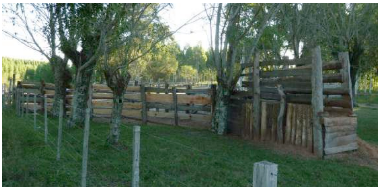
De loskade van Bardanca's verzamelplaats