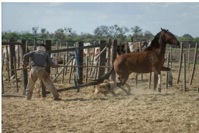
Honden worden ingezet om de paarden bijeen te drijven. (foto 2012)