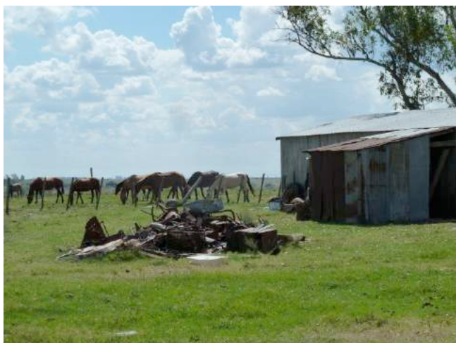
De verzamelplaats van Bonfrisco, leverancier bij Clay

's Namiddags rijden we naar de verzamelplaats van paardenhandelaar Bonfrisco, ten zuiden van Artigas, langs de grens met Brazilië. Bonfrisco leverde in 2014 438 paarden aan het slachthuis Clay. Zijn verzamelplaats ligt in een erg afgelegen gebied en is moeilijk te vinden. Als we er uiteindelijk aankomen, stellen we vast dat er helemaal niemand is. De kralen achter het vervallen gebouw staan leeg. De loskade bevindt zich in erbarmelijke staat. Op een grote weide achter de kralen staan een twintigtal paarden en een veulen. Twee paarden manken. Het kwik loopt vandaag op tot 34°C, maar er is geen beschutting voorzien op de weide en schaduw van bomen is er al evenmin. Iets meer naar de voet van de heuvel zien we beenderen liggen. Daar is waarschijnlijk een paard gestorven zonder dat iemand iets gemerkt heeft. De weide is begroeid met middelhoge struiken, waardoor we moeilijk kunnen zien of er gewonde of zieke paarden op de grond liggen. Het is bovendien nog maar de vraag hoe vaak er iemand naar de paarden komt kijken, want er woont duidelijk niemand in het gebouw.