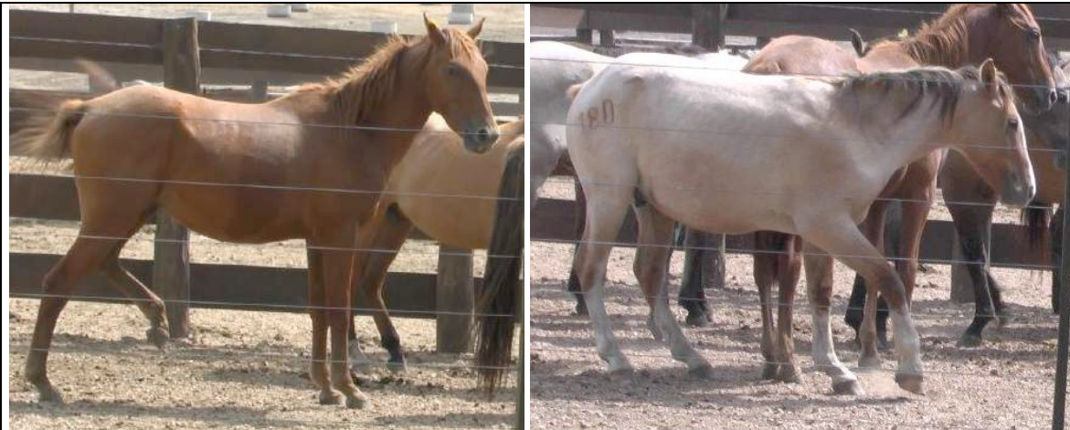
Gewonde paarden kunnen slechts op drie benen staan.