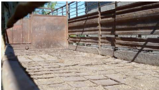
De verroeste trailer van Bardanca, met scherpe sleuven langs de wanden

Wanneer we in Mercedes aankomen, vragen we de weg naar Bardanca's boerderij. De buurtbewoners hebben echter alleen weet van een privéwoning van Bardanca in Palmitas. We rijden erheen, maar er is niemand thuis. Op het terrein staan een grote en een kleinere transportwagen. Op de vloer van de grote wagen ligt paardenmest. De aanhangwagen ziet er gammelt uit en is volledig verroest. In de zijwanden zitten sleuven met scherpe randen, waarin de benen van veulens en pony's geklemd kunnen raken. De banden van de aanhangwagen zijn tot de naad versleten. Ze hebben vrijwel geen profiel meer. We stellen zelfs scheuren in de banden vast. Op de stuurcabine lezen we "BARDANCA", waaruit we kunnen afleiden dat de wagen nog steeds gebruikt wordt. Hieruit blijkt eens te meer hoe nonchalant de dieren worden behandeld. De aanhangwagen is volkomen ongeschikt voor het vervoer van dieren, en is zelfs gevaarlijk.