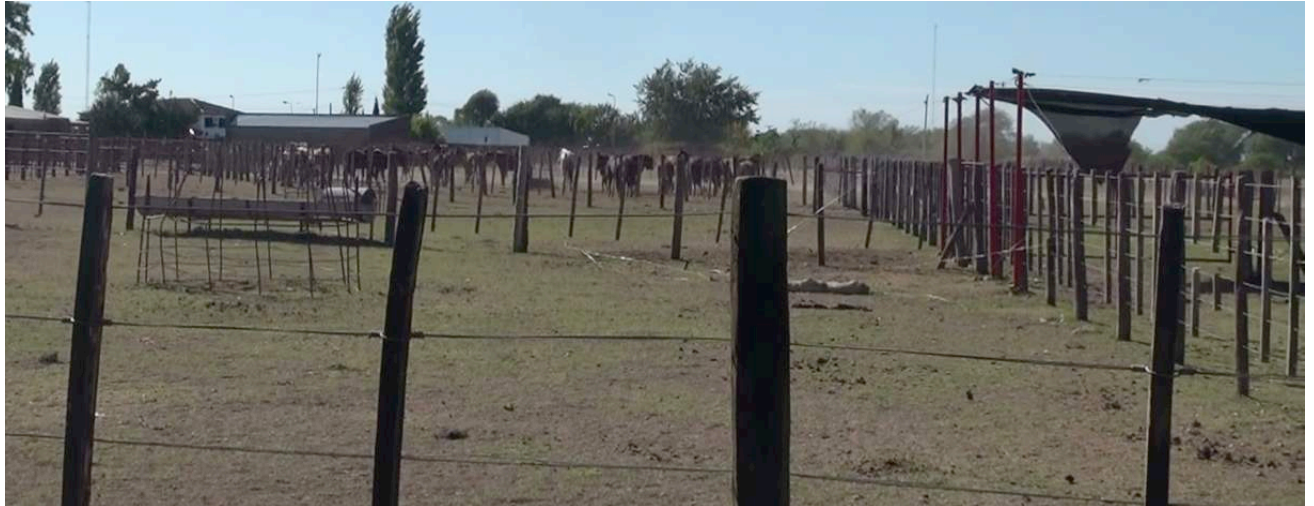
Paarden in een paddock zonder beschutting of voedsel

van ontbinding. Het lijkt erg aannemelijk dat de paarden zijn bezweken tijdens het transport of in de kralen van het slachthuis gestorven zijn.