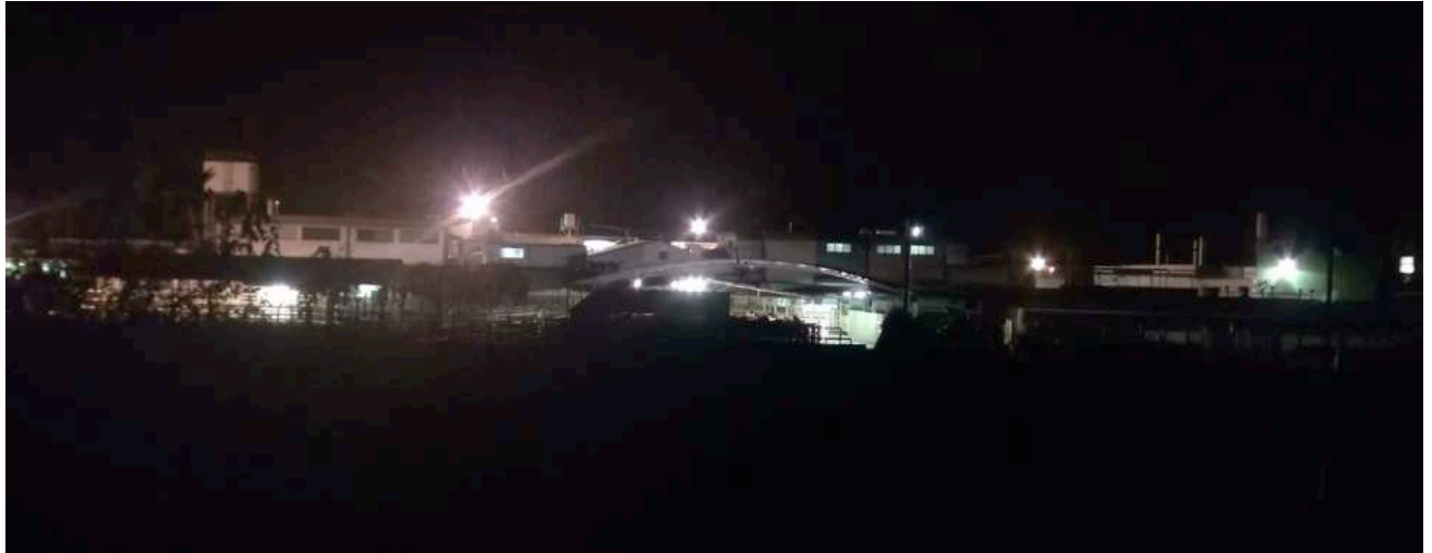
De Lamar-site 's nachts