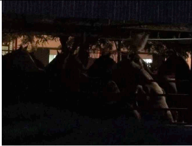
De paarden glijden uit en vallen op de gladde betonnen vloer.