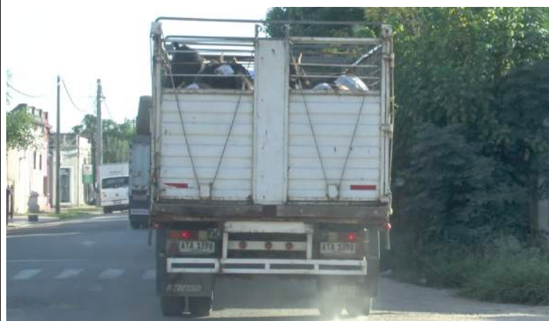
Paarden van uiteenlopende groottes worden in dezelfde laadruimte vervoerd.