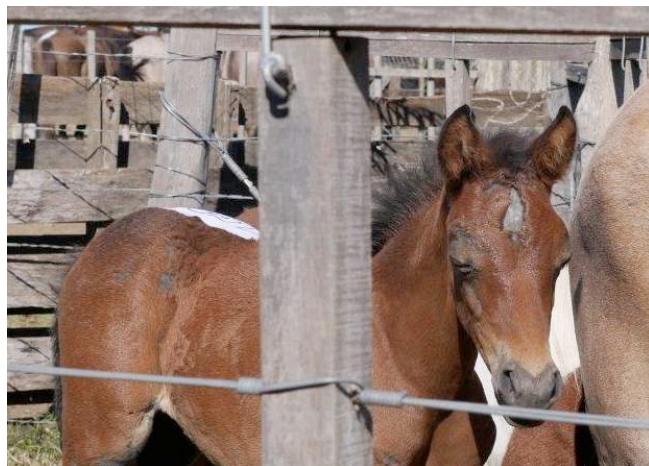
Een veulen heeft schafwonden aan het hoofd en een gezwollen oog.