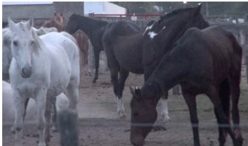
De witte merrie lijkt zwanger, terwijl het magere paard gewond is aan een van de achterste benen.