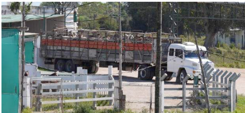
Paarden worden uit een gammele transportwagen gelost bij het slachthuis Clay.