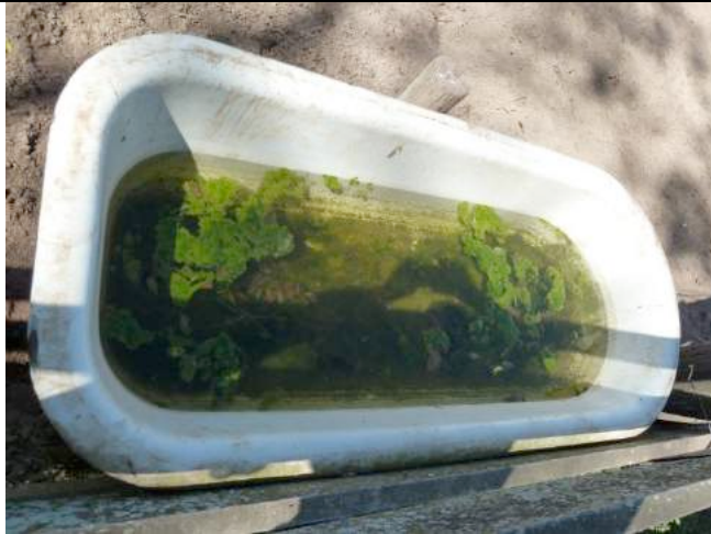
Het water in de trog zit vol algen.