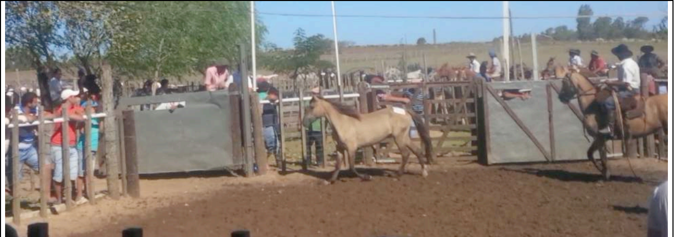
Een paard met een gebroken been hinkt op drie benen door de ring.