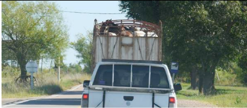
Het metalen traliewerk boven de hoofden van de paarden hangt erg laag.