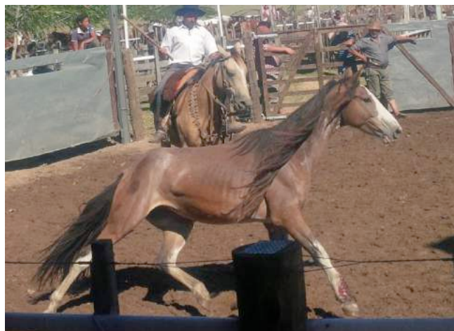
Een paard met een verse, open wonde wordt door de ring gejaagd.