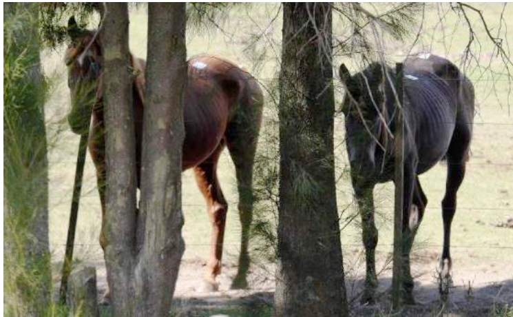
Magere paarden met duidelijk zichtbare ribben en heupen