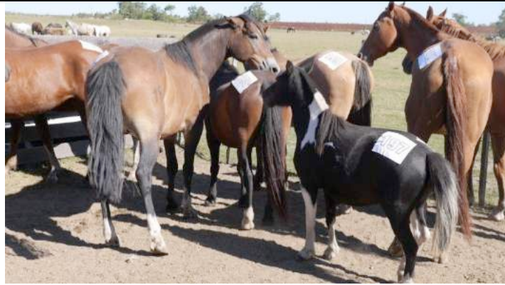
Paarden van uiteenlopende groottes worden samen vervoerd.