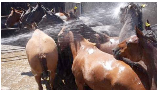
De waterstraal wordt recht in het gezicht van de paarden gespoten.