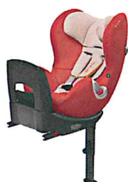
AUTUMN GOLD 514105014

De SIRONA is verkrijgbaar in geselecteerde winkels. De nieuwe kleuren zijn beschikbaar vanaf JANUARI 2014.