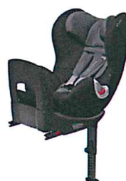
STORM CLOUD 514105013