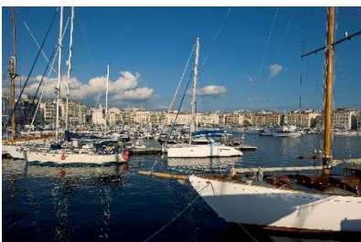
Vieux port de Marseille

Vous en avez assez de l'hiver ? Il est grand temps de réserver vos vacances d'été ! Le Thalys Soleil, le célèbre train rouge, emmène ses voyageurs chaque samedi du 24 juin au 26 août vers les villes ensoleillées de Valence, Avignon, Aix-en-Provence et Marseille. Les billets sont disponibles à partir du jeudi 9 février, de quoi commencer à rêver d'escapades dans le sud. Pas d'embouteillages, pas de stress et pas de fatigue. Au contraire, détente assurée pour un voyage rapide et confortable à bord du Thalys Soleil.