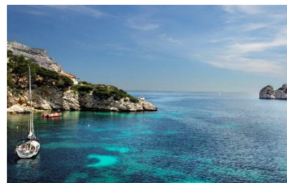
Calanque Sormiou