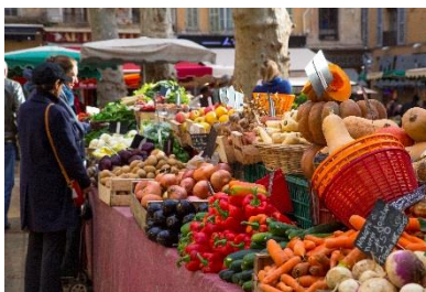
Marché Aix-en-Provence