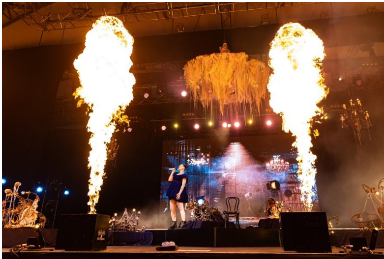
歌手 Anne-Marie 依靠森海塞尔 Digital 6000 麦克风系统奉上精彩演出

“这让艺人们充满信心，因为他们知道 D6000 将帮助他们顺利完成精彩演出。艺人们可以跑到人群中与观众互动，而不必担心脱离传输范围，Anne-Marie 就经常这样与粉丝互动。麦克风头的可互换性也是一个非常大的亮点。”