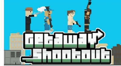
DU'h9 JW `Yf' New Eich Games

"CrazyGames has been really helpful in providing good traffic & visibility for my game Tunnel Rush. I earn €1000 monthly for my game and I plan to launch a lot more games with them. The CrazyGames team are some of the coolest personalities I have met, very positive people & smooth communicators."