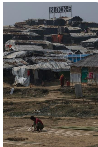
Asentamiento de Jamtoli.

La entrada es gratuita y los horarios de visita son de lunes a viernes y domingo: de 10 a 14 h y de 16 a 20 h y sábado: de 10 a 14 h.