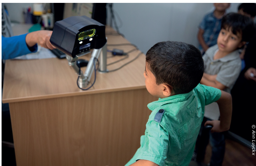
Dit jongetje laat zich registreren met de biometrische oogherkenning. Dat is soms een hele uitdaging.

In het registratie centrum van Amman komen dagelijks 3000 vluchtelingen langs die niet in een kamp wonen. We waren allemaal heel erg verrast om te horen dat 85% van alle vluchtelingen niet in een kamp wonen, maar in de steden doorheen Jordanië.