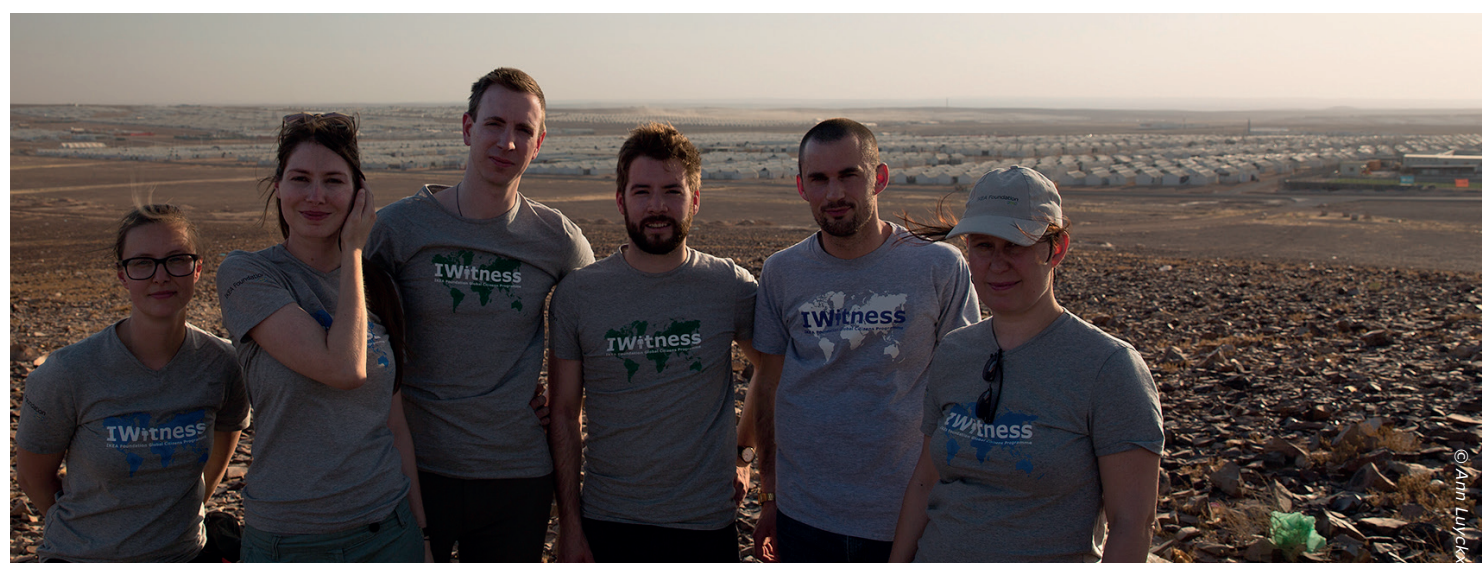
Onze IWitness groep met op de achtergrond het Azraq kamp. We hebben samen veel beleefd.

Onze terugvlucht wordt afgeroepen. We zitten samen om te debriefen en kijken allemaal naar elkaar. Het wordt stil. Waar moeten we immers beginnen. Er valt zo veel te vertellen, zo veel emoties te delen.