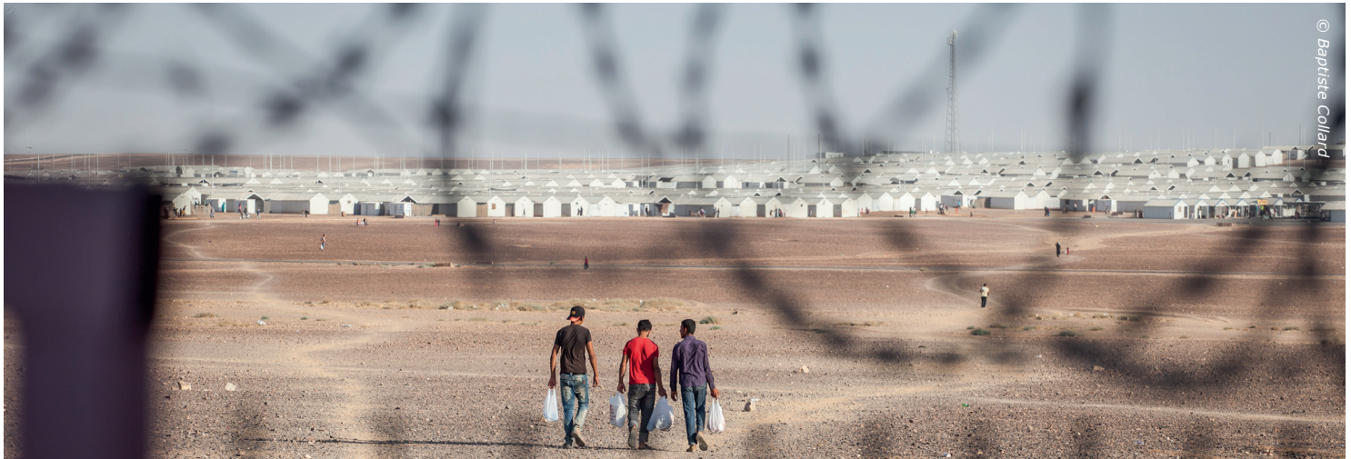
De ligging van het kamp: letterlijk 'in the middle of nowhere'

Tijdens de autorit naar Azraq zagen we geleidelijk aan het landschap veranderen. Er was minder en minder bewoning en meer en meer zandheuvels met stenen. We zitten midden in de hete woestijn, en ineens doemt het kamp op.