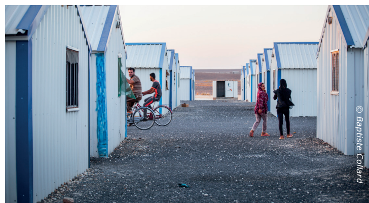
Eén van de straten in Azraq, waar nog geen straatverlichting is.

Bovendien betaalt het project zichzelf terug in 2 jaar, dus het is én economisch én duurzaam. Het is dankzij de energie van alle medewerkers en klanten dat we zo'n projecten gerealiseerd krijgen.