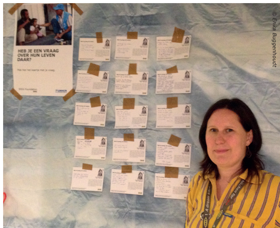
De vragen die mijn collega's stelden voor mijn vertrek

In de kampen waar wij zullen gaan, zijn de meeste kinderen gelukkig nog bij hun ouders. Ik heb gelezen dat er in Azraq 56% kinderen zijn. Dat moet toch een impact hebben op het dagelijkse leven daar? Zijn er scholen? Speeltuinen? Worden er kinderen geboren? Is er psychologische hulp?