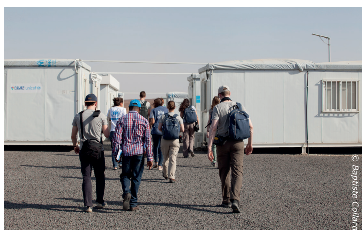
Iedereen (IWitness deelnemers, IKEA Foundation, UNHCR) gaat dezelfde kant op in Azraq: op weg om te helpen.

Een vluchteling verblijft gemiddeld 17 jaar in een kamp en/of buiten zijn thuisland. We moeten deze kinderen een eerlijke kans op een mooie toekomst geven.