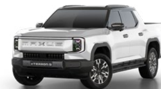
Pearl Lustre White