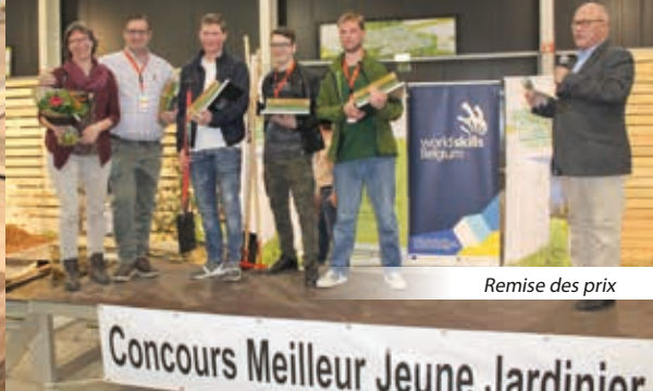
Remise des prix