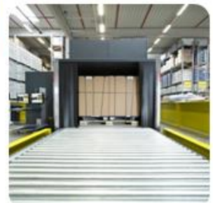
Training van veiligheidspersoneel, air cargo röntgenfotoinstallatie, Neu-Isenburg