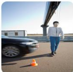
Proefopstelling voetganger beschermstelsel, Klettwitz