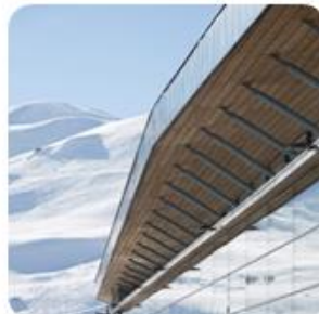
Bouwsupervisie Tignespace sportcentrum, Franse Alpen