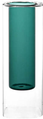
Glazen vaas Andro € 32,99