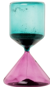
Glazen zandloper Nereid € 25,99