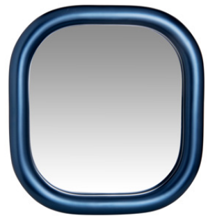
Spiegel Dione € 69,99