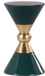
Groene en goudkleurige tafeldecoratie € 45,99