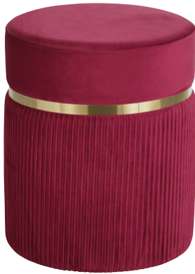
Framboosroze fluwelen poef € 69,99