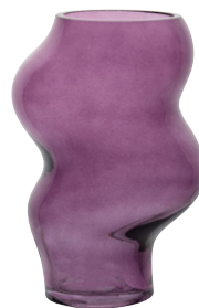
Glazen vaas Doris € 14,99