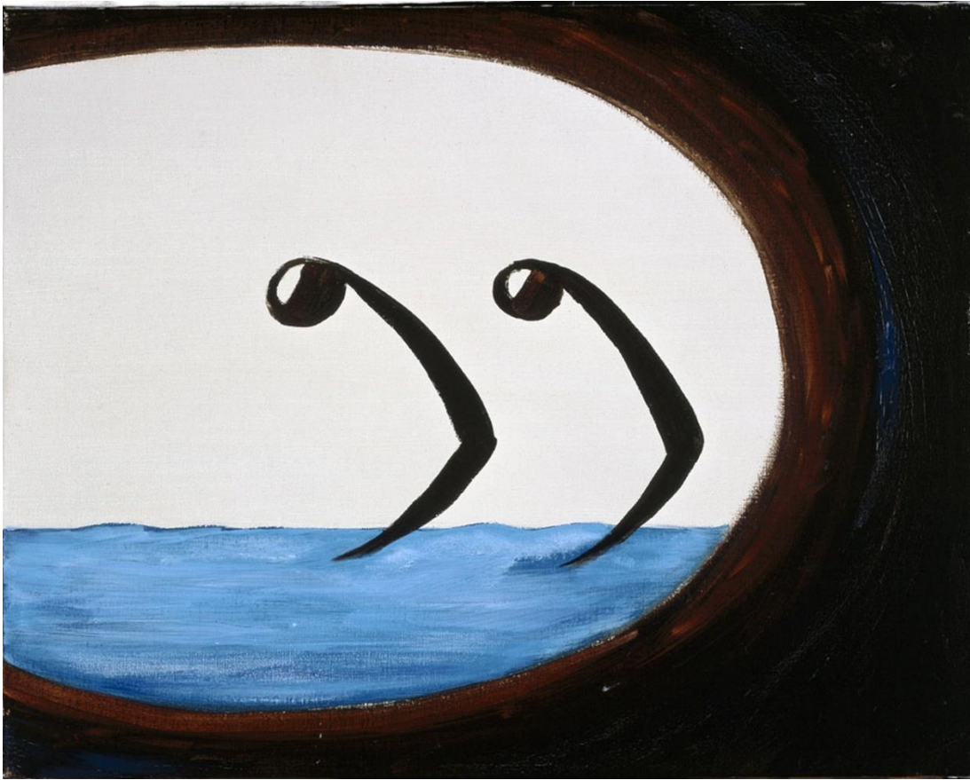
'Caution', Walter Swennen, 2011, Cera-collectie bij M Leuven © de kunstenaar, foto: Philippe Debeerst