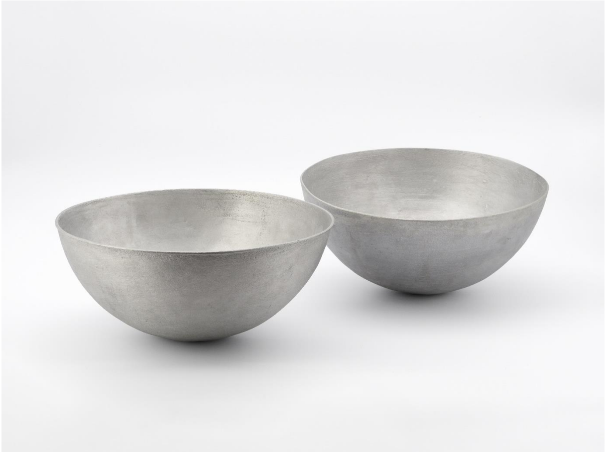
'La Pichennette', Ann Veronica Janssens, 1996, Cera-collectie bij M Leuven © de kunstenaar, foto: Art In Flanders & Meemoo, Cedric Verhelst)