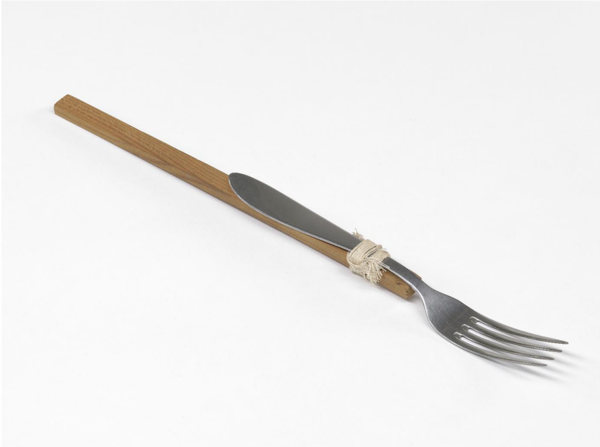
Zonder titel, René Heyvaert, 1979, Cera-collectie bij M Leuven © de kunstenaar

Dit bescheiden werkje (van formaat, niet van impact) ligt op een tafel waarrond de bezoeker kan bewegen. Er is geen voorgeschreven oriëntatie, dit object heeft geen vaststaande onder- of bovenkant. De andere kunstwerken die ook op de tafel liggen, hebben wel een duidelijke leesrichting en nodigen de kijker uit om rond de tafel te cirkelen.