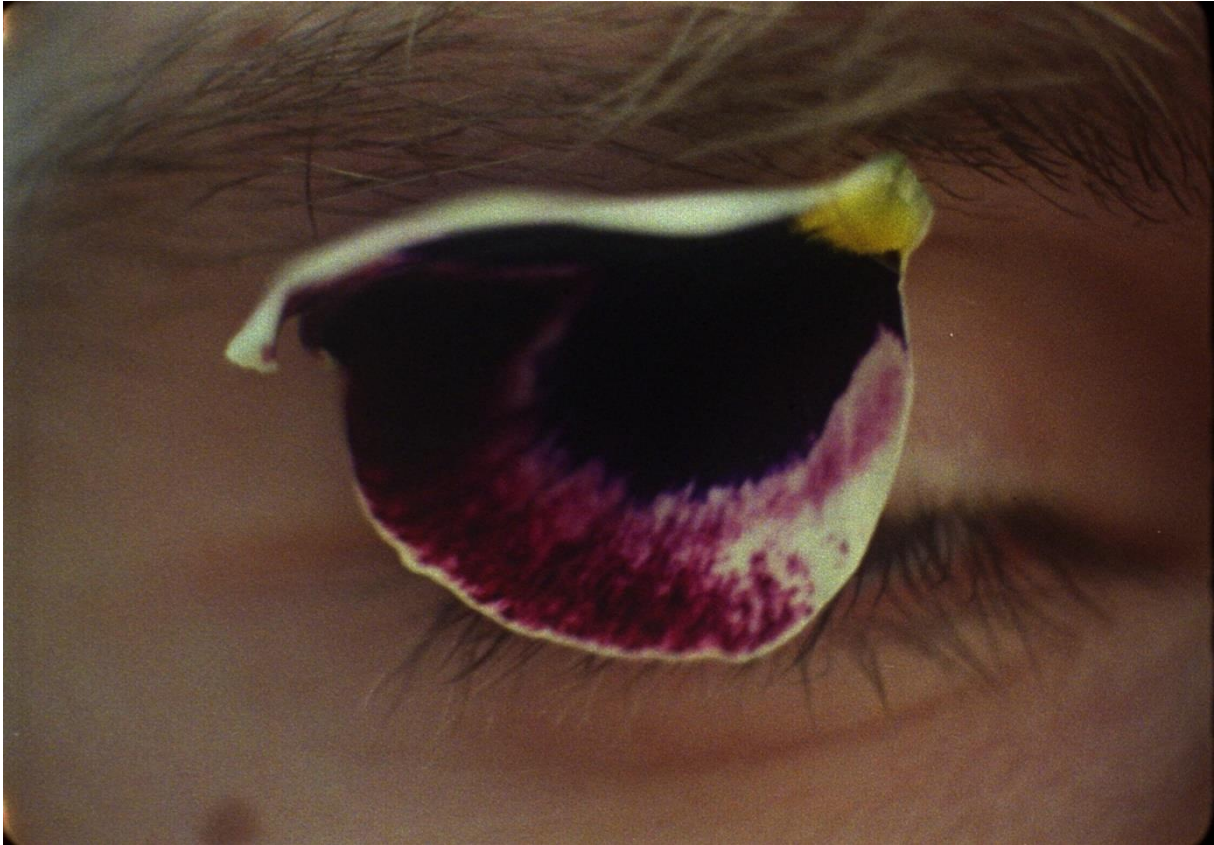
'Corolla', Gintautė Skvernytė, 2019, Cera-collectie bij M Leuven © de kunstenaar

Gefascineerd door verschillende manieren van interactie, begon Gintautė Skvernytė te werken met paraffine, een wendbaar materiaal dat eindeloos gewijzigd kan worden door druk of inkervingen. Deze ervaring met kneedbare materialen leidde naar analoge kleurfilm, eveneens een gevoelig membraan dat kortstondige beelden kan dragen. 'Corolla' is haar eerste 16mm-film. Deze stille film toont zeven close-ups van oogleden waarop bloemblaadjes kleven. Door de onvrijwillige beweging van de ogen fladderen de bloemblaadjes als vlinders. De in lus geprojecteerde film heeft sculpturale eigenschappen: tactiliteit, materialiteit (de fysieke drager van de film maakt deel uit van de kijkervaring) en dynamiek. De zachte, nauwelijks voelbare aanraking van de bloemblaadjes legt een bijkomende laag op de opeenstapeling van membranen: huid op huid op huid. De volledige gezichten krijgen we nooit te zien, er is weinig herkenning of identificatie. Wat centraal staat is de aanraking van het vegetale en het menselijke en hoe er op de grens van beide werelden een subtiele verwevenheid plaatsvindt.