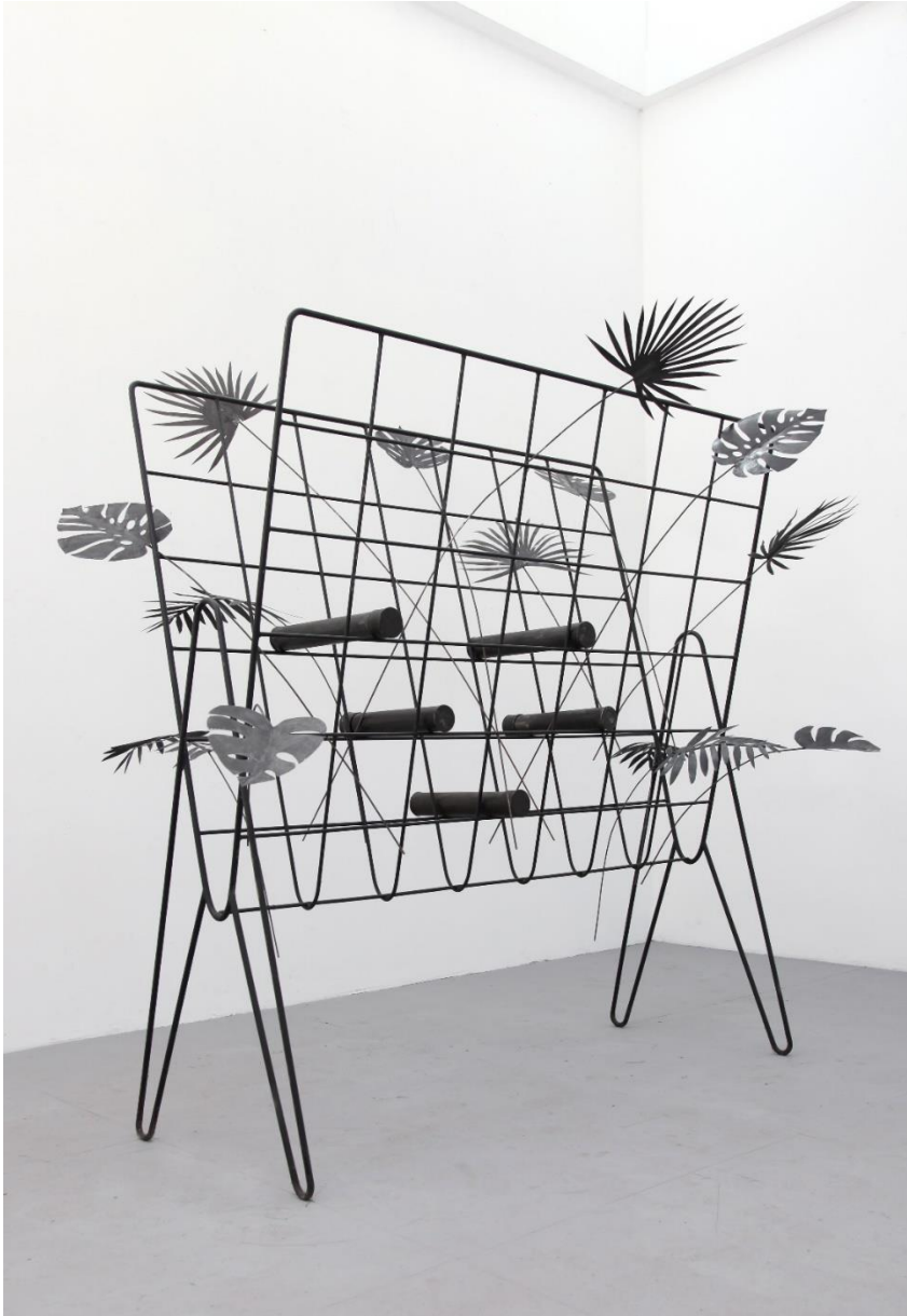
'Tropical Archive', Paul Casaer, 2020, Collectie Vlaamse Gemeenschap bij M Leuven © de kunstenaar

De buitenproportionele schaal van het krantenrekje en de gestileerde bladeren van tropische planten doen op een vreemde manier vertrouwd aan. Alsof het meubel boven zichzelf uitstijgt en een dwingend monument wordt voor andere werelden. De naoorlogse huiselijkheid waar kamerplanten en geïllustreerde pers stonden voor een comfortabele en geconnecteerde manier van leven, de eerste prille stappen in een geglobaliseerd bestaan, wordt zachtjes onderuit gehaald door de unheimlige schaal en de titel. Ondanks de pulserende diversiteit van culturen en de paradijselijke fauna en flora, hebben de tropen in onze contreien allerlei ongunstige connotaties gekregen. Tristes tropiques, onze onverkwikkelijke koloniale geschiedenis, ondervoeding en lelijke ziektes komen tegelijk onze huiskamer binnen via de tijdschriften.