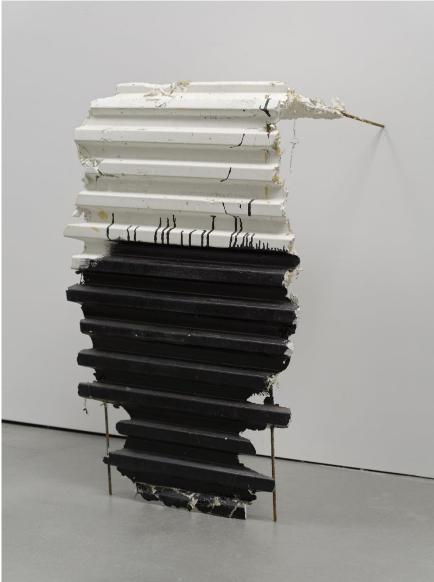
'LXXXVIII', Leyla Aydoslu, 2019, Collectie Vlaamse Gemeenschap bij M Leuven © de kunstenaar, foto: Art In Flanders & Meemoo, Cedric Verhelst

De buitenproportionele schaal van het krantenrekje en de gestileerde bladeren van tropische planten doen op een vreemde manier vertrouwd aan. Alsof het meubel boven zichzelf uitstijgt en een dwingend monument wordt voor andere werelden. De naoorlogse huiselijkheid waar kamerplanten en geïllustreerde pers stonden voor een comfortabele en geconnecteerde manier van leven, de eerste prille stappen in een geglobaliseerd bestaan, wordt zachtjes onderuit gehaald door de unheimlige schaal en de titel. Ondanks de pulserende diversiteit van culturen en de paradijselijke fauna en flora, hebben de tropen in onze contreien allerlei ongunstige connotaties gekregen. Tristes tropiques, onze onverkwikkelijke koloniale geschiedenis, ondervoeding en lelijke ziektes komen tegelijk onze huiskamer binnen via de tijdschriften.