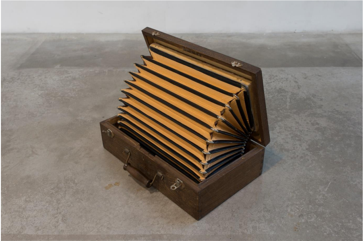
'Cash Cow', Gerard Herman, 2022, Cera-collectie bij M Leuven, foto: de kunstenaar, courtesy Waldburger Wouters