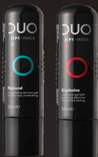
Glijmiddel DUO Natural en Glijmiddel DUO Explosive PRIJS 4 : € 9,99 / 50 ml.

In België gebruikt 44 % van de condoomgebruikers ook glijmiddelen 3 , om hun seksleven extra pit te geven of omwille van problemen met vaginale droogte. Om hun verlangens in te willigen, lanceert DUO nu 2 nieuwe glijmiddelen van hoge kwaliteit: