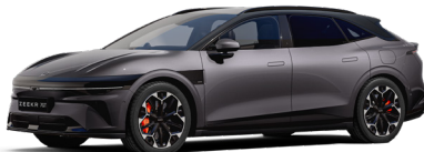
Mystic Lilac (non disponible sur Core)