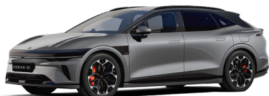
Tech Grey (En option)