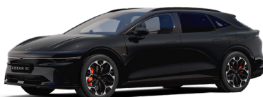
Onyx Black (En option)