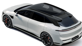
Toit noir contrasté (De série uniquement sur Privilège AWD)