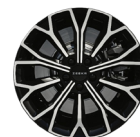
Jantes en alliage 19 pouces à Multi-branches