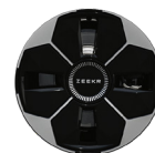
Jantes en alliage 19 pouces Aéro (Standard Core)