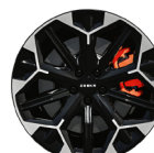
GT Jantes en alliage 20 pouces, disque de frein & étriers fixes 4 pistons (avant), étriers orange