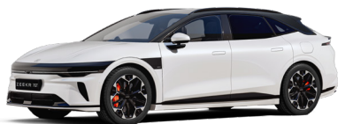
Crystal White (De série)