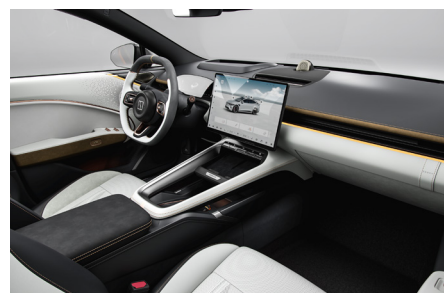
Sellerie cuir (Nappa & PU) POLAR WHITE & CHARCOAL BLACK & HAZEL (En option sur Privilège AWD Launch Edition)

*Consommation d'énergie combinée du Zeekr 7GT en kWh/100 km : 16,6 - 19,8 (WVTA), émissions de CO 2 combinées en g/km : 0, consommation de carburant combinée en l/100 km : 0. Les chiffres sont basés sur l'homologation WLTP. L'autonomie électrique est influencée par des facteurs incluant, mais sans s'y limiter, le style de conduite et les conditions routières.