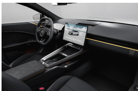
Sellerie tissu (Textile & PU) Intérieur noir BERMUDA SLOPE (De série sur Core)