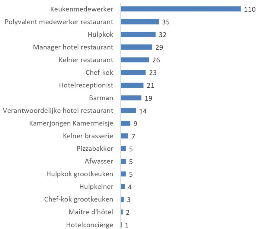
Figuur 3 Openstaande vacatures voor horecapersoneel in de stad Antwerpen eind januari 2022