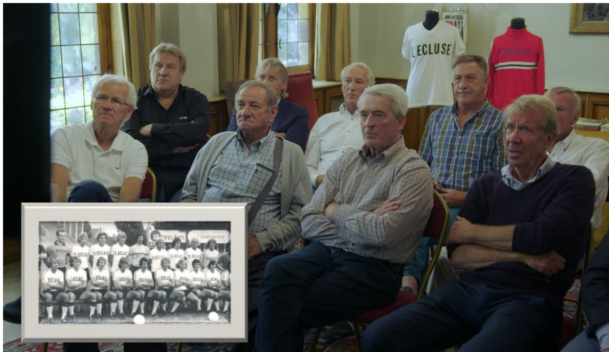
De ploeg van RWDM in 1975 en nu