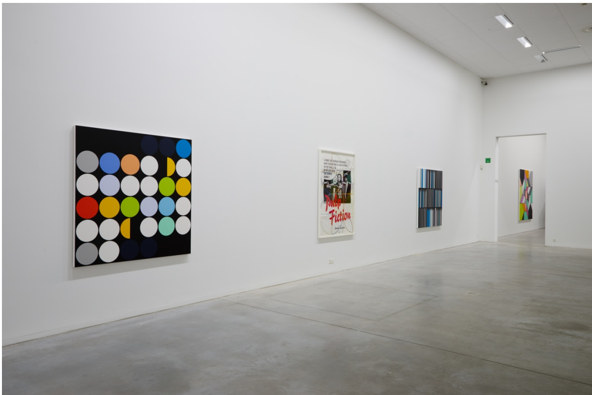
From left to right: January 2014 [Rio] (2014), Pulp Fiction (2013), Banco Aliança [Rio] (2013)