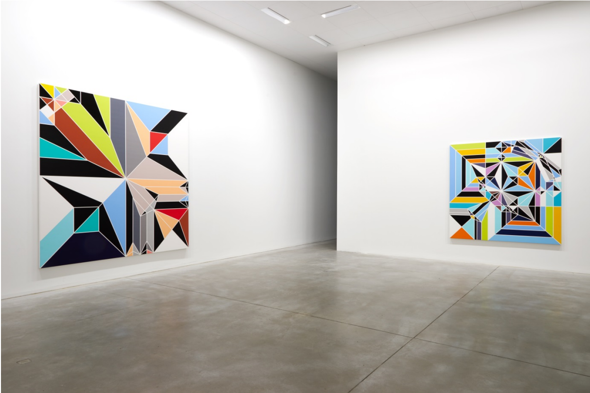
From left to right: Rockhopper [Origami] (2009) & Angel [Origami] (2009)