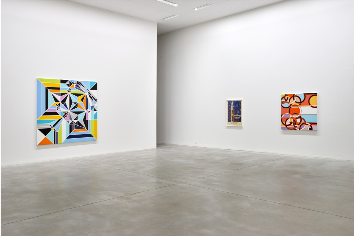
From left to right: Angel [Origami] (2009) & El Ultimo Testigo [The Parallax View] (2013) & 1976 [Rings] (2008)