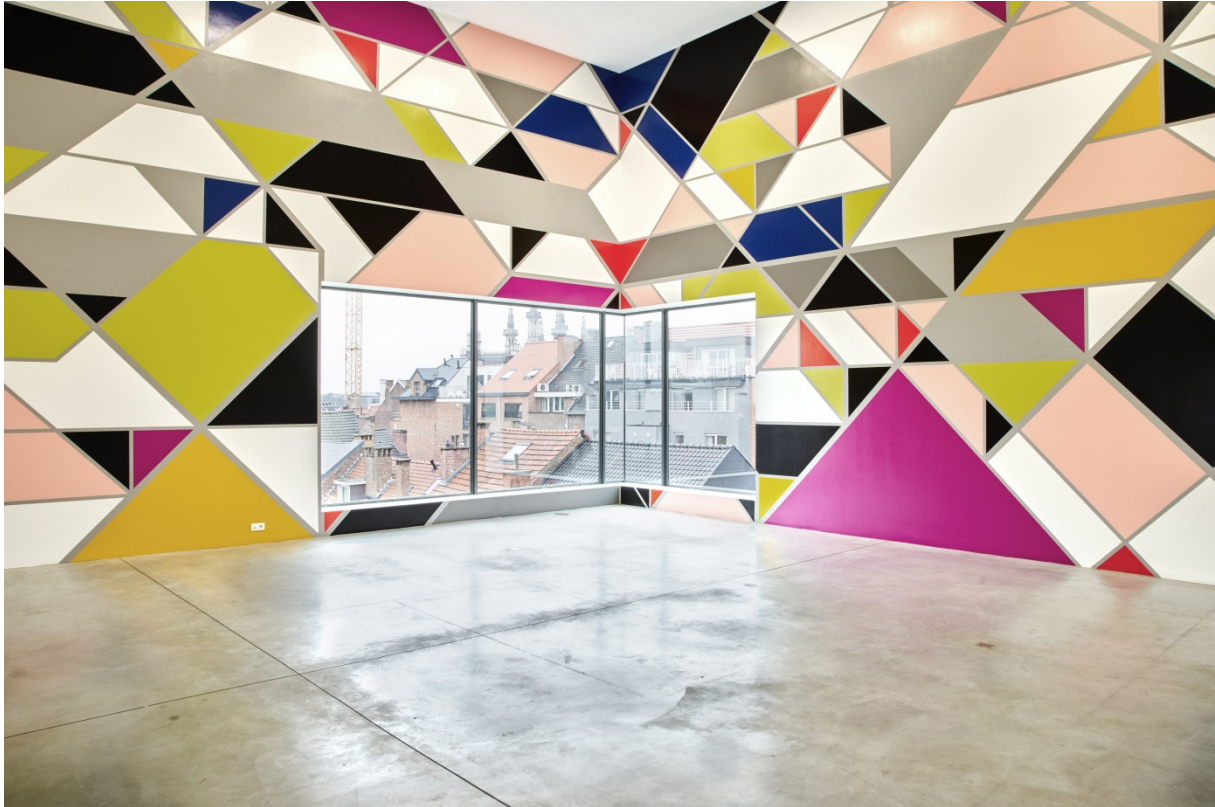
Maqta [Abu Dhabi] (2015), M - Museum Leuven

Voor de bovenste museumzaal van M ontwierp Sarah Morris een nieuwe schildering op twee muren. Dit tijdelijk werk zet de toon voor de tentoonstelling. Gedurende vier weken werkten vijf schilders aan de muurschildering die uit 11 verschillende kleuren bestaat. Het indrukwekkende raster is 23 meter breed en 7 meter hoog. Met deze muurschildering is Morris niet aan haar proefstuk toe. Haar oeuvre telt vijftien ontwerpen en muurschilderingen op maat van een locatie, zoals voor de London Underground Gloucester Road Station ( Big Ben , 2012) of voor K20 in Düsseldorf ( Hornet , 2010).