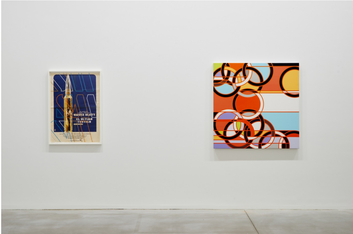
From left to right: El Último Testigo [The Parallax View] (2013) & 1976 [Rings] (2008)