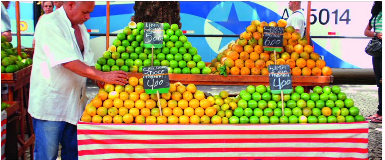
Rio (2012)

De geflopte film 'It's All True' van Orson Welles vormde de aanleiding voor de film 'Rio' (2012). Hierin toont Sarah Morris het tegenstrijdige karakter van Rio de Janeiro. Je ziet een wereld van feest, zon, stranden, fruitmarkten, ziekenhuizen, voetbalstadions, de architectuur van Oscar Niemeyer tot favela's, politieagenten en stadscontrole. Parallel maakte ze de schilderijenreeksen 'Rio', en 'São Paulo', gebaseerd op de grootste metropool van Brazilië. Titels zijn voor Morris een manier om een "virtuele architectuur" te creëren.