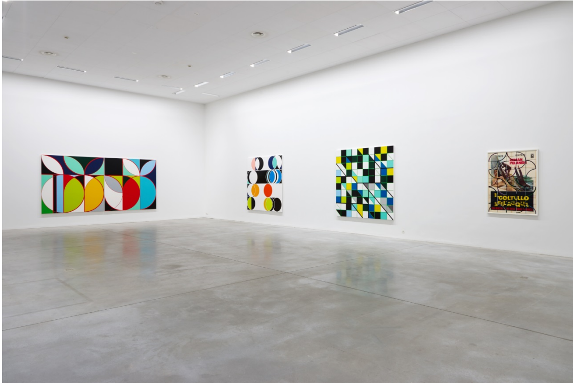
From left to right: Eletrobass [Rio] (2013), Total Lunar [Rio] (2014), Cosan [Rio] (2013) & Il Coltello Nell'Acqua (2014)