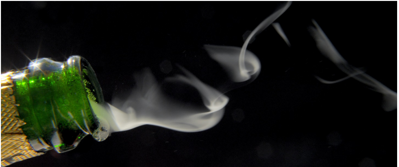
Strange Magic (2014)

De laatste film, Strange Magic (2014), neemt je mee naar Parijs. De titel verwijst naar de vreemde aantrekkingskracht van de stad, in positieve en negatieve zin. De film is een coproductie met de Louis Vuitton Foundation. Hierdoor kreeg Sarah Morris toegang tot de fabrieken van luxemerken zoals Dior of Moët & Chandon. Een terugkerend element in de film is het vloeibare. Denk daarbij niet alleen aan fonteinën, de Seine, het water rond het Frank O. Gehry-gebouw, champagne of parfum, maar ook aan het vloeibare of ontastbare van geld, van het kapitaal. Deze film balanceert opnieuw tussen rijkdom en armoede, flirt met luxe, maar neemt er tegelijk afstand van. De initialen van de film Strange Magic zijn dezelfde als die van Sarah Morris zelf (S.M.).