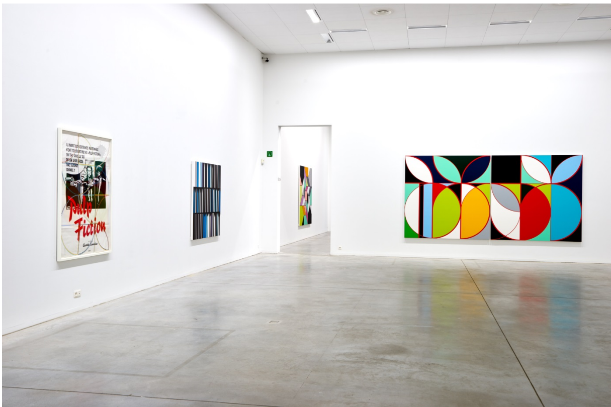
From left to right: Pulp Fiction (2013), Banco Aliança [Rio] (2013) & Eletrobás [Rio] (2013)