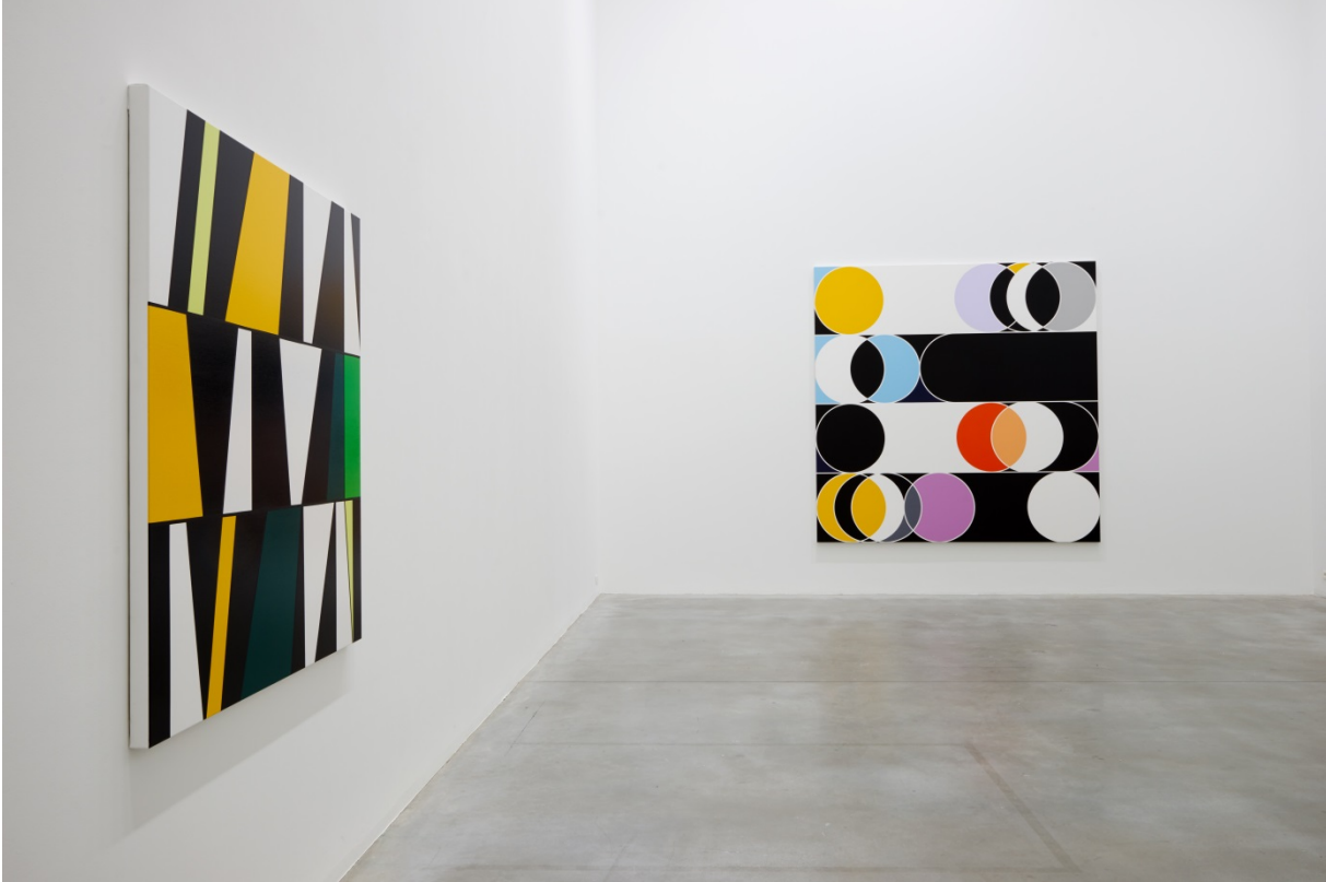
From left to right: Esther [São Paulo] (2014) & Annual Solar Eclipse [Rio] (2014)