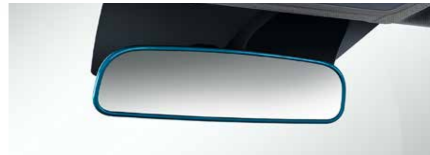
Gekleurde achteruitkijkspiegel 2