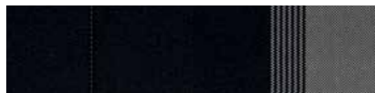
Obsidian Black white stripes (Twist & Twist TechnoPack)