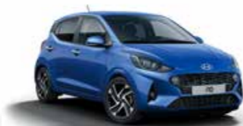
Champion Blue U2U/U24*