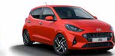
Tomato Red TTR/TT4*