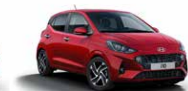
Dragon Red WR7/WR4*