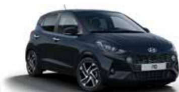
Phantom Black X5B