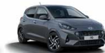
Star Dust V3G