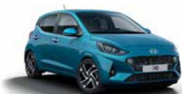
Aqua Turquoise U3H/U34*