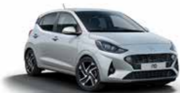
Sleek Silver RYS/R4*