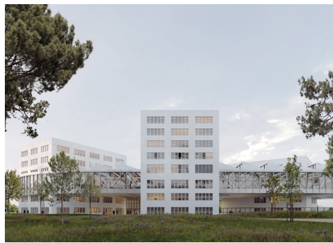
OFFICE 176 RTS Radio Télévision Suisse