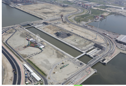
Kieldrechtsluis - Antwerpen