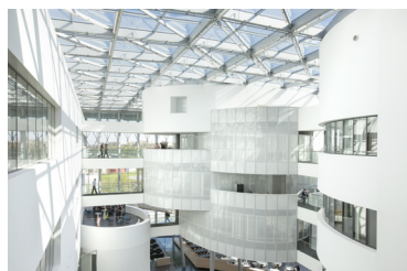
Barco One Campus (i.s.m. P. Lallemand)