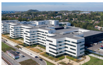
Ziekenhuis CHC Nizar Bredan Assar Architects en Artau Architects