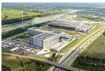
Nike European Logistics Campus