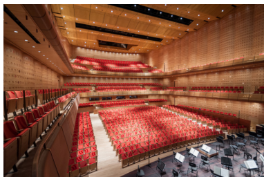
Elisabeth Center - Antwerpen