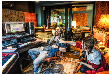
Selah Sue - studio