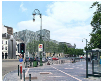
Axa - Brussel