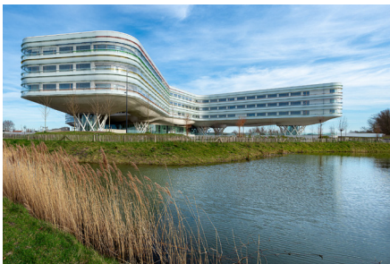
AZ Zeno Knokke-Heist