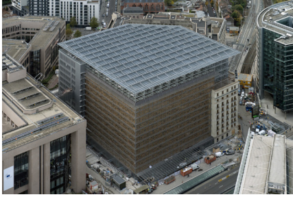
Résidence Palace - Brussel