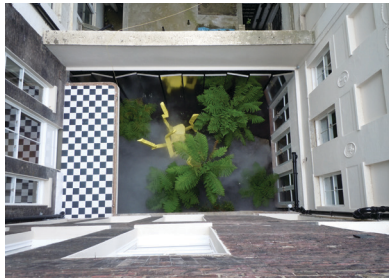
Sunken Garden, London