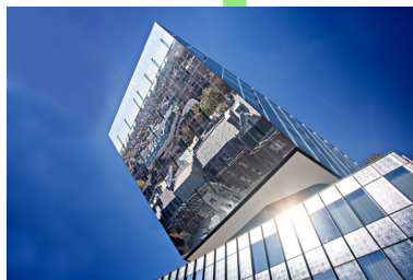
Stadskantoor 't Scheep - Hasselt