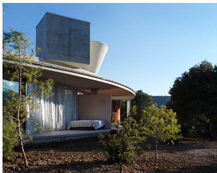
OFFICE 130 SOLO House (Spanje)