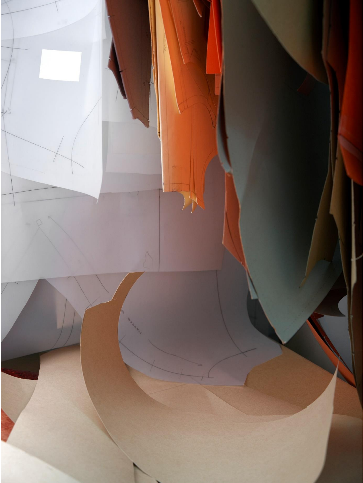
Thomas Demand, Model Studies IV, chaffinch, 2020, Copyright of the artist, VG Bild-Kunst, Bonn