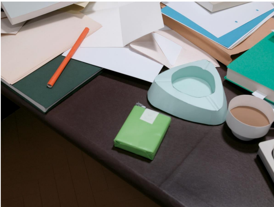
Thomas Demand, Embassy VII.a, 2007, Copyright of the artist