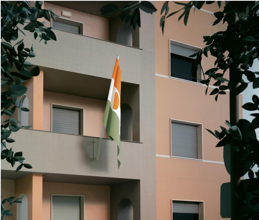
Thomas Demand, Embassy I, 2007, Copyright of the artist