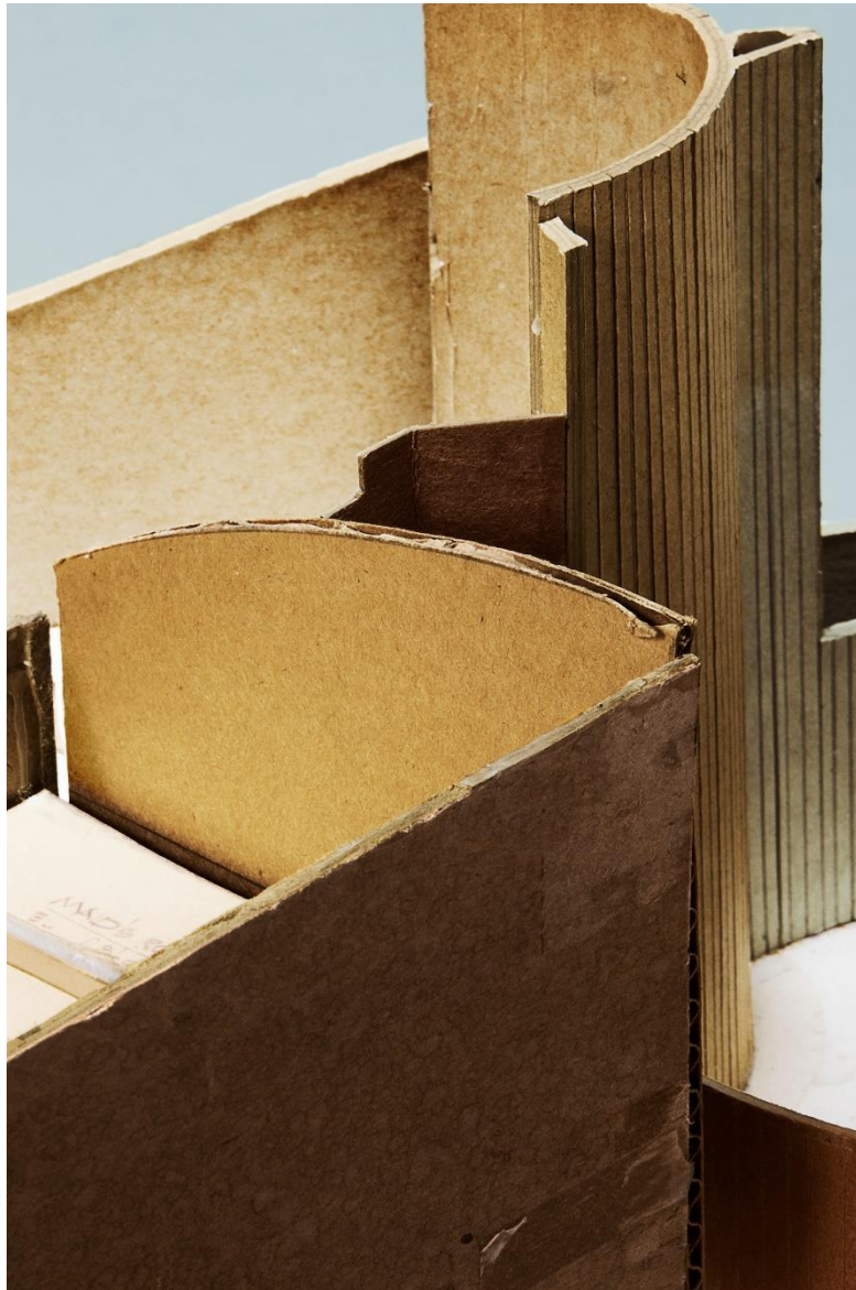
Thomas Demand, Segel #49, Model Studies I, 2011

John Lautner (1911-1994) was een Amerikaans architect die vooral bekend werd met zijn ontwerpen van gebouwen die functionele sculpturen lijken. Na een stage bij Frank Lloyd Wright begon hij een eigen praktijk in Los Angeles. De meeste van zijn projecten zijn dan ook tot stand gekomen in de staat Californië. Enkele maquettes van ontwerpen die nooit gerealiseerd werden, zijn bewaard gebleven in het Los Angeles Getty Research Institute. Tijdens een residentie aan het Getty Institute in 2013 kreeg Demand de kans om die maquettes te bestuderen en te fotograferen. Het leverde een reeks werken op die vooral focust op de sculpturale kwaliteiten van Lautners architectuur.