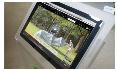
Hoe zet je een tent op