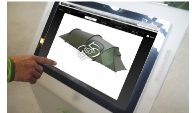
Bekijk de tent van buiten - 360 graden

De touchscreens van Nordisk kunnen in 200 shops in Europa worden uitgetest. Je kunt ook een virtuele tour van de Nordisk tenten maken op nordisk.eu .