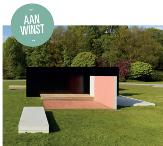
© Andrea Zittel, Sadie Coles HQ, London & Andrea Rosen Gallery, New York

De Amerikaanse kunstenaar creëerde het werk Panel Pavilion speciaal voor de tentoonstelling 'The Flat Field Works' (2015). Het werd aangekocht met de steun van de Middelheim Promotors.